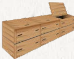
LE COMPOST EN PALETTE