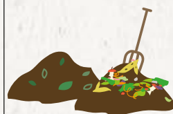
LE COMPOST EN TAS