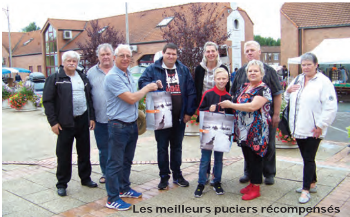
Les meilleurs puciers récompensés

Des réunions ont eu lieu entre élus, services municipaux et Police Nationale afin de préparer au mieux la braderie du 4 septembre : un périmètre différent des autres années mais permettant d'assurer une sécurité optimale comme exigée par la préfecture.