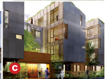
1 ère phase opérationnelle du projet de restructuration du centre ville ( projet de logements collectifs et individuels)

La restructuration du quartier de la gare constitue le point « clé » de l'opération d'aménagement, de restructuration et de requalification urbaine de notre ville, non seulement parce que la gare est un pôle d'échanges majeur de la région en matière de transport mais aussi parce que son implantation actuelle constitue une fracture dans le tissu urbain. Les travaux qui vont avoir lieu ont pour but de vous offrir à terme, un véritable centre-ville avec une place de