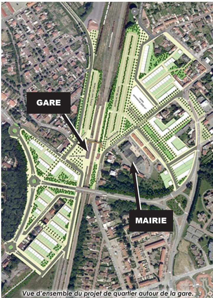
Vue d'ensemble du projet de quartier autour de la gare.

Le pôle gare actuel se situe au cœur de notre ville et la scinde en deux.