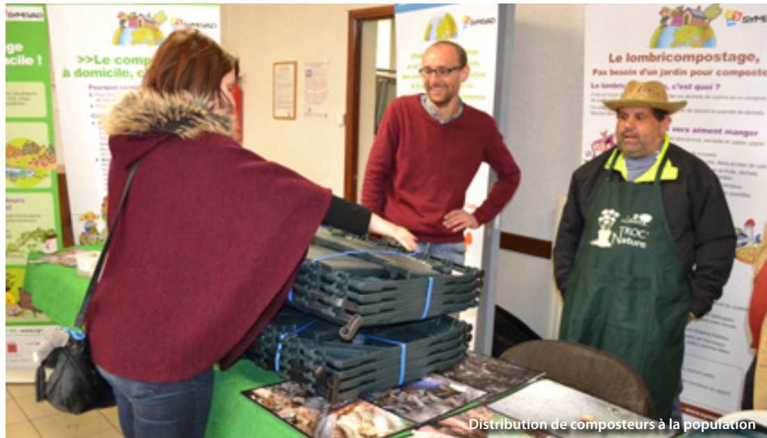
Distribution de composteurs à la population

Grâce à la participation de l'association ALFA et des ateliers jardins, un buffet inaugural a été proposé aux participants. La bibliothèque R.Devos a invité les enfants à créer un mur végétal à partir de palettes relookées pour l'occasion. Eden 62 les a conviés à un atelier de