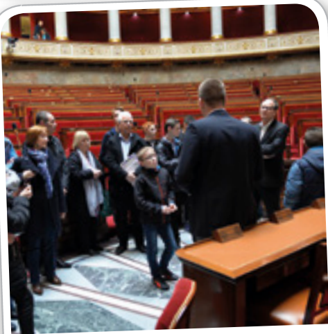
Visite du Conseil Municipal des Jeunes à l'Assemblée Nationale, le 5 avril