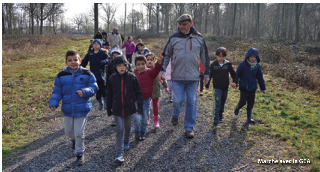
Marche avec la GEA

Pas-de-calais» leur a permis de participer à différents ateliers sous forme de jeux : palets, paysages, puzzles, quizz, une façon amusante d'en apprendre davantage sur la faune et la flore qui peuplent nos espaces naturels.