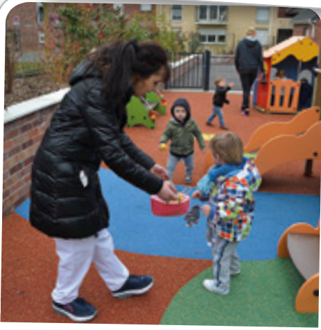
Chasse aux oeufs à l'Ilot Câlin, le 24 mars