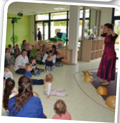
Spectacle «Au fil de l'eau» à l'Ilot Câlin, le 3 mai