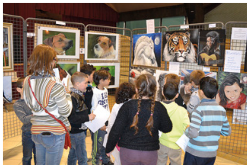
Les élèves libercourtois au salon des Arts Plastiques