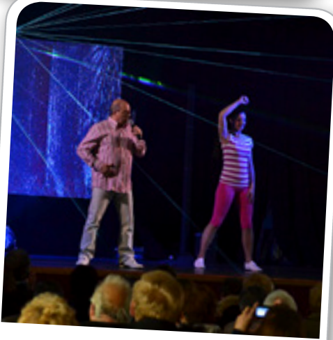
Spectacle Planète 80, le 24 avril