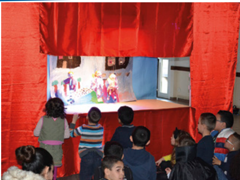
Spectacle de l'association Lire Ensemble Agréablement