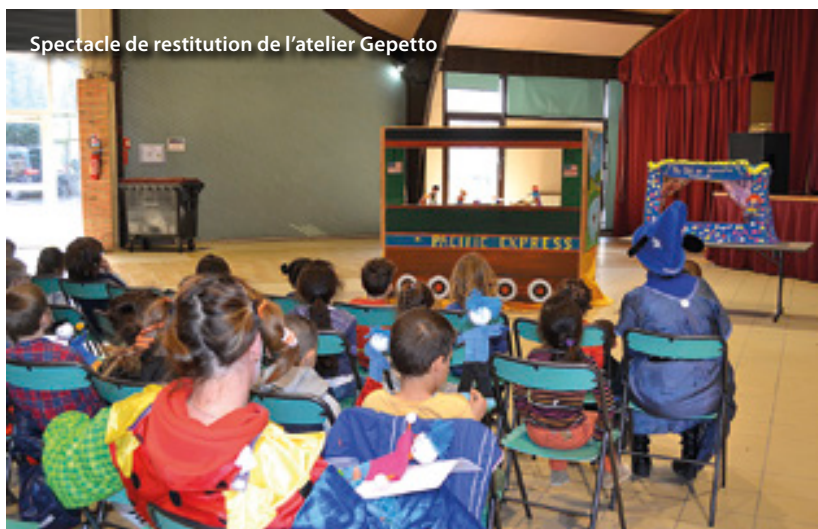
Spectacle de restitution de l'atelier Gepetto