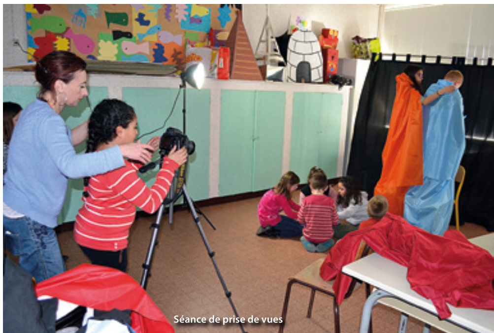
Séance de prise de vues