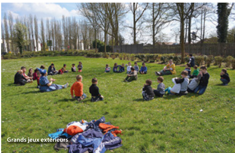
Grands jeux extérieurs