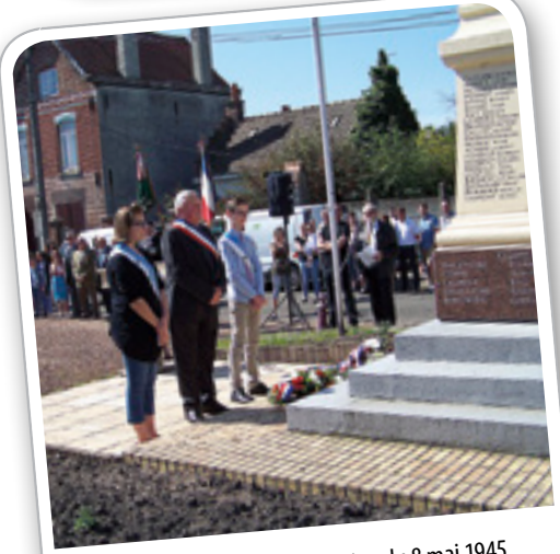
Cérémonie de commémoration du 8 mai 1945