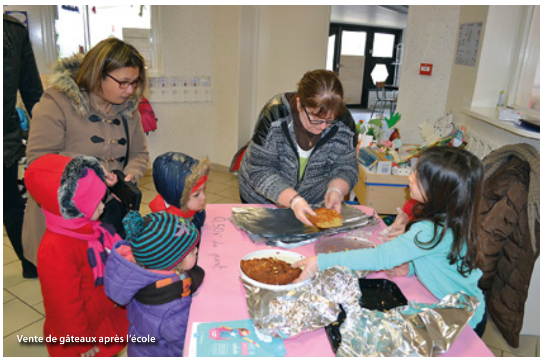
Vente de gâteaux après l'école