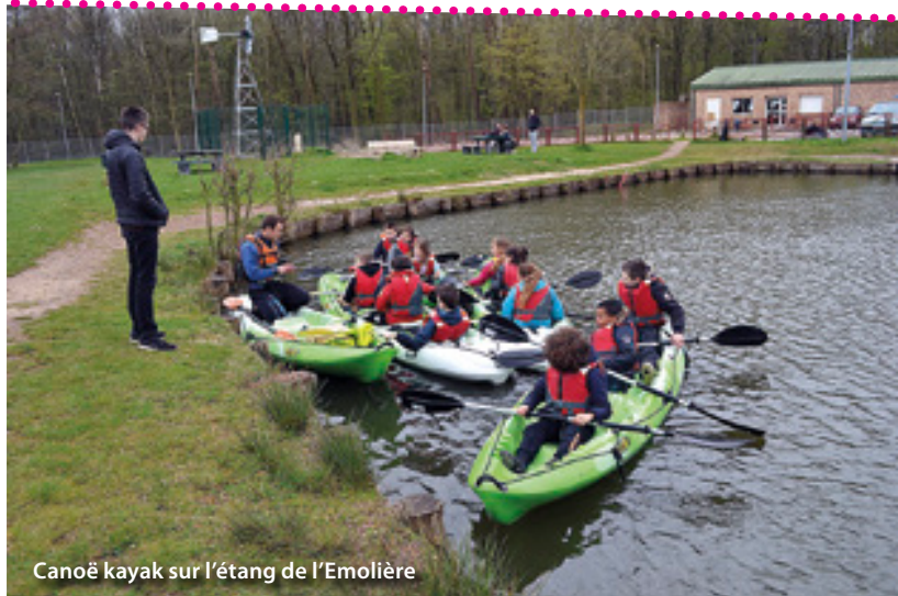
Canoë kayak sur l'étang de l'Emolière