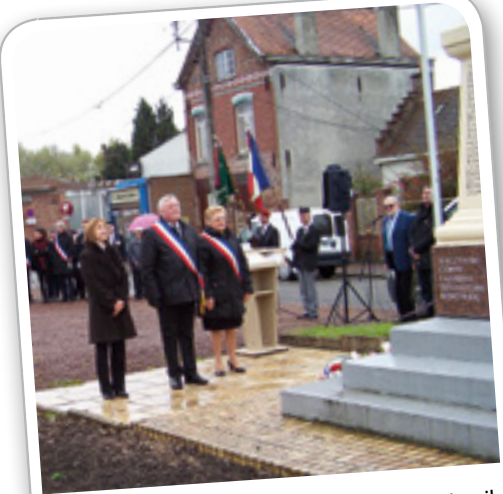
Commémoration de la Journée des Déportés, le 24 avril