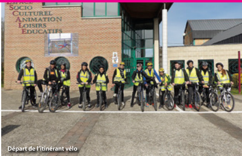
Départ de l'itinérant vélo