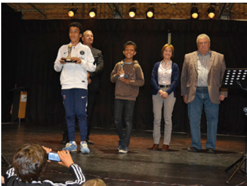
Soirée des récompenses de l'OMS

fidéliser et animer un réseau de bénévoles : communication interne de l'association