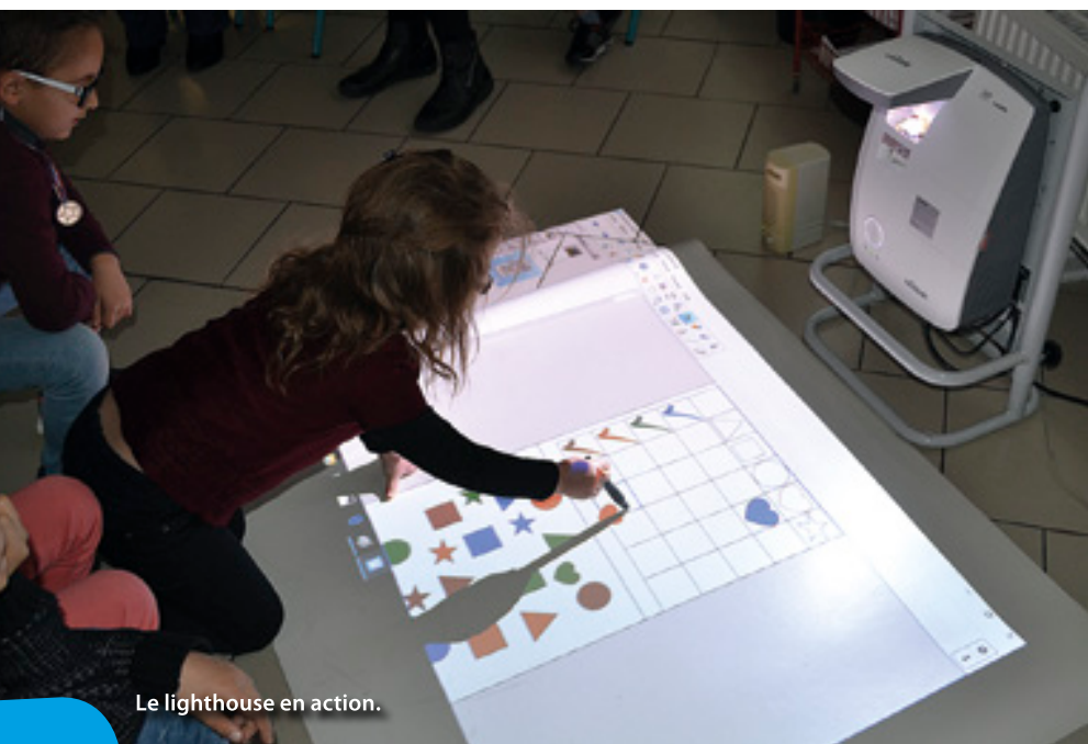
Le lighthouse en action.

Les écoles élémentaires de la commune sont équipées de Tableaux Blancs Interactifs. Ce dispositif, véritable succès auprès des élèves, a son équivalent chez les plus petits : le lighthouse.