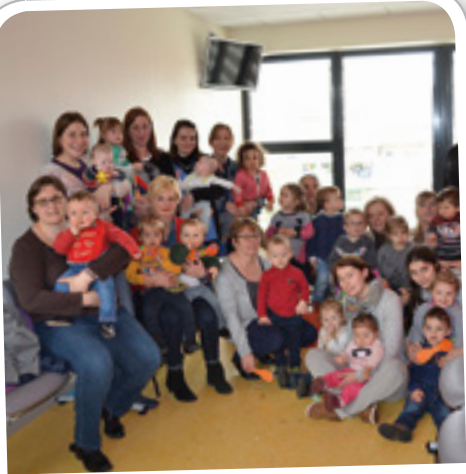
Fête du Printemps au Relais des Assistantes Maternelles, le 21 mars