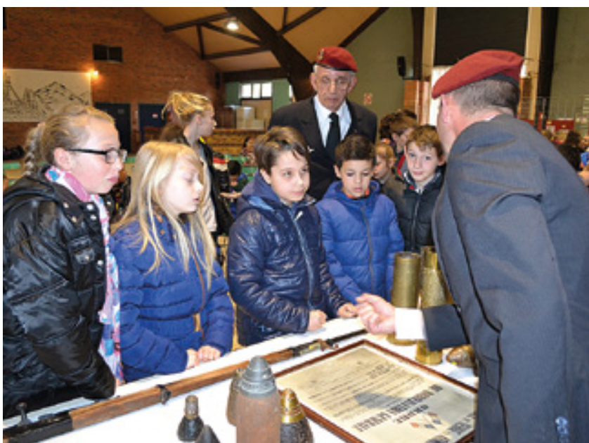
Devoir de mémoire avec les Anciens Combattants