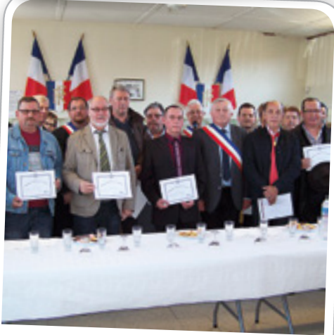
Remise des diplômes du travail, le 1 er mai