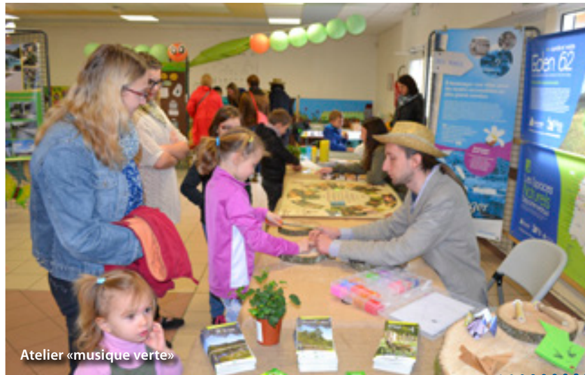
Atelier «musique verte»