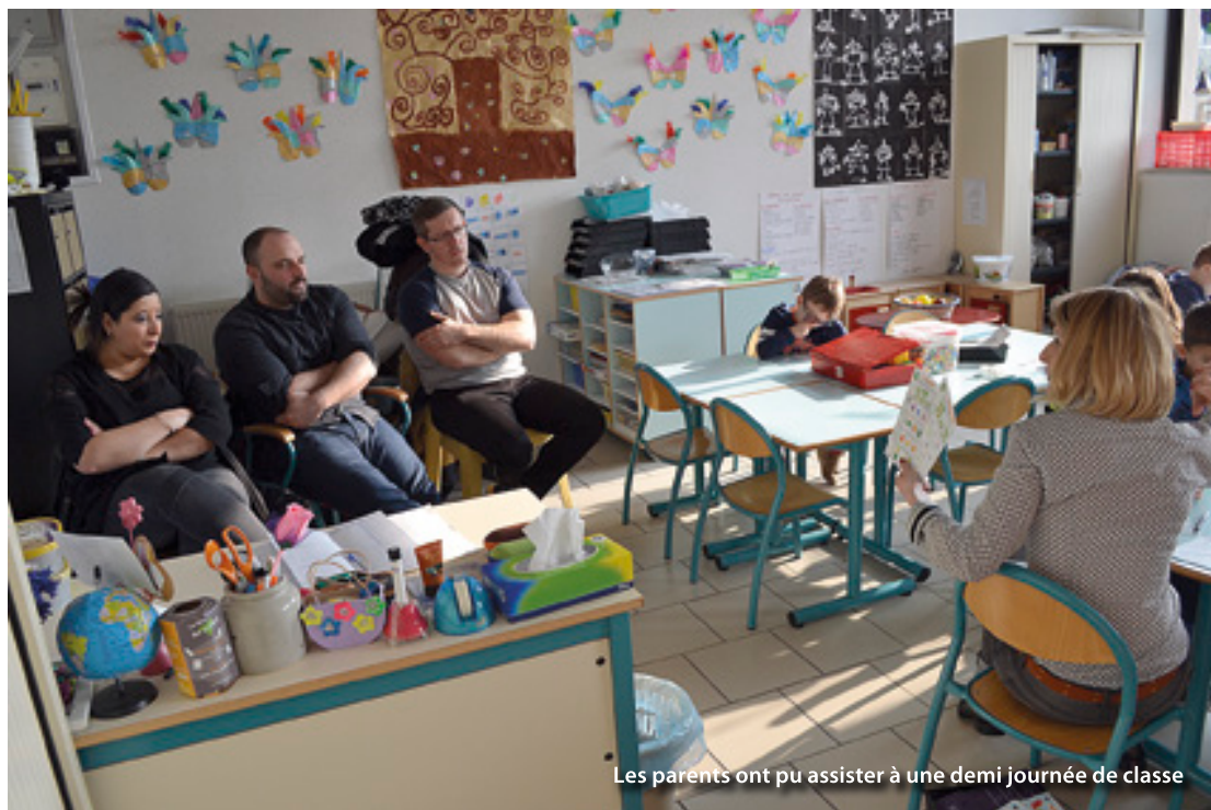
Les parents ont pu assister à une demi journée de classe