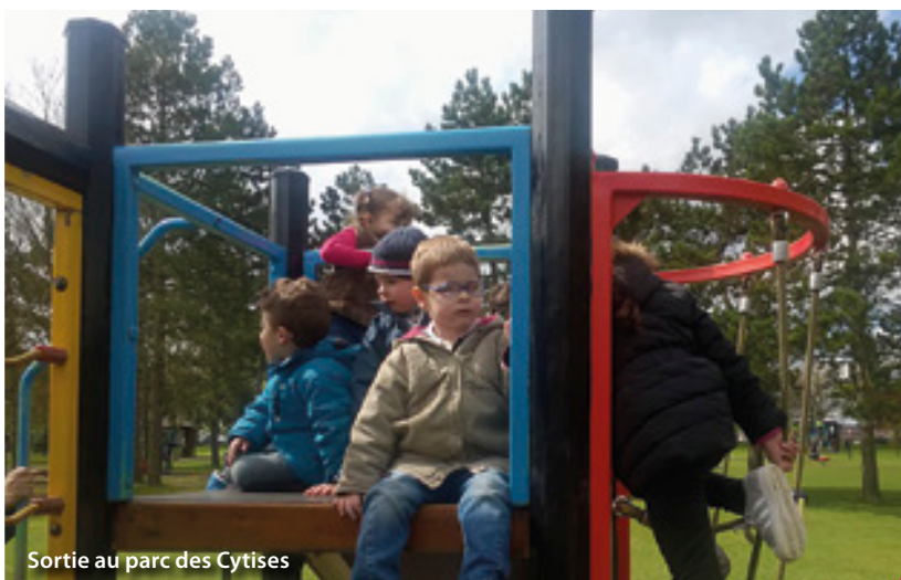
Sortie au parc des Cytises