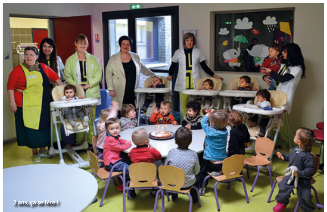
2 ans, ça se fête !

La capacité d'accueil est de 25 places. Ouvert du lundi au vendredi de 8 h à 18 h. Centre multi-accueil l'Ilot Câlin, 4 rue Galilée 62820 Libercourt Tél : 03 21 45 61 95