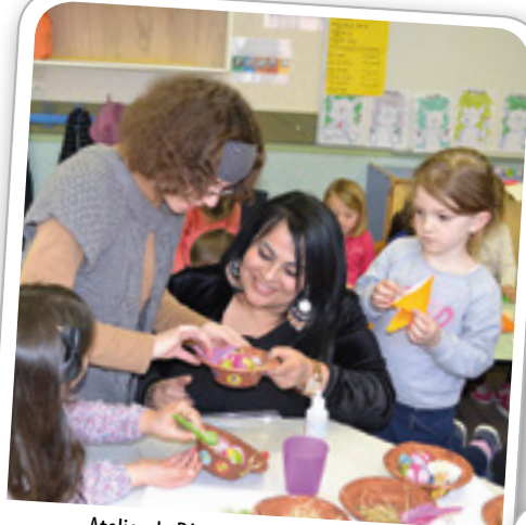
Atelier de Pâques à l'Accueil de Loisirs du Mercredi, le 23 mars