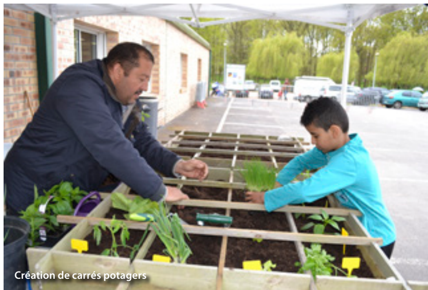
Création de carrés potagers

plus tôt ont pu récupérer leur composteur et bénéficier de conseils pour la création d'un bon compost auprès du Symevad. Réduire ses déchets, cultiver son jardin, sensibiliser les enfants à la nature, autant de gestes à adopter pour préserver notre planète que la municipalité a souhaité mettre à l'honneur.