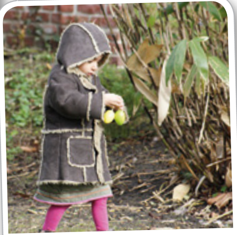
Chasse aux oeufs au Domaine de l'Épino, le 27 mars