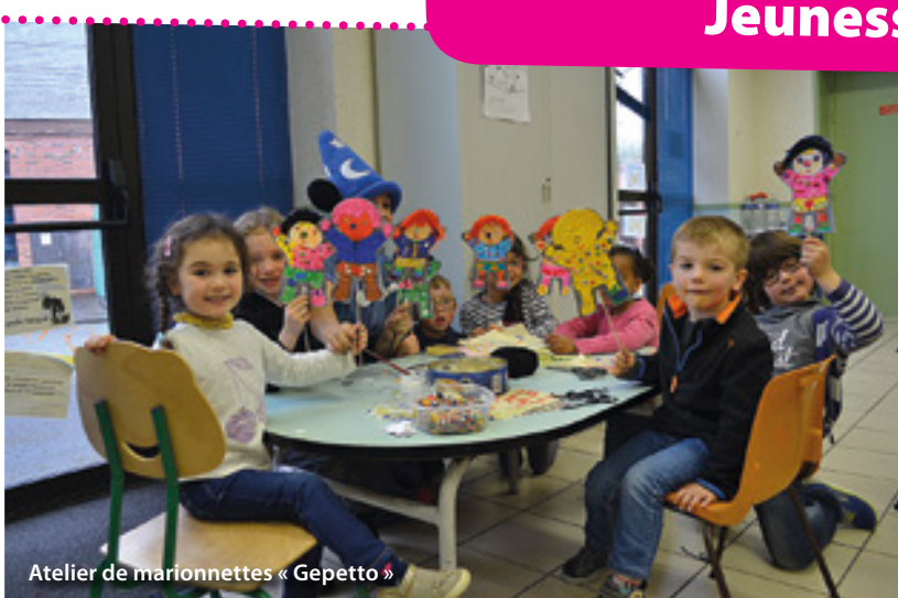
Atelier de marionnettes « Gepetto »