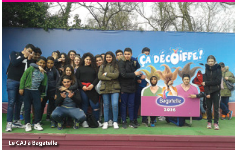
Le CAJ à Bagatelle