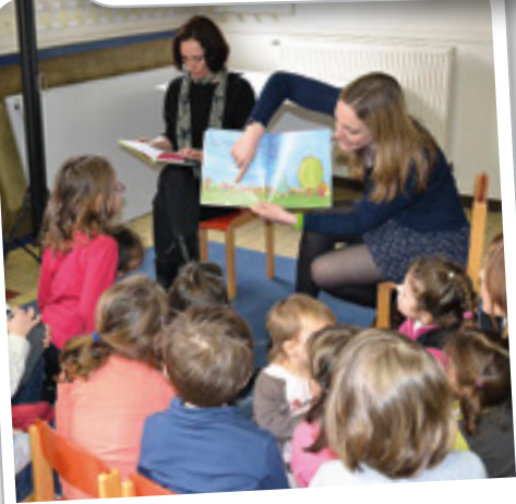
Goûter conté des animaux de printemps, le 23 mars