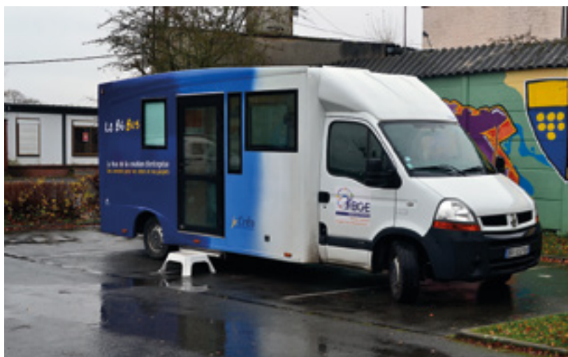
Plus de renseignements sur www.bge-hautsdefrance.fr

Aménagé en espace de bureaux pour accueillir le public, le BGE bus est parti à la rencontre des habitants de Libercourt et des alentours qui ont une idée, un projet de création ou de reprise d'entreprise, mais qui n'ont jamais osé pousser les portes des structures d'accompagnement. Le conseiller était présent pour accompagner les personnes intéressées et leur délivrer des conseils gratuits et sans rendez-vous.