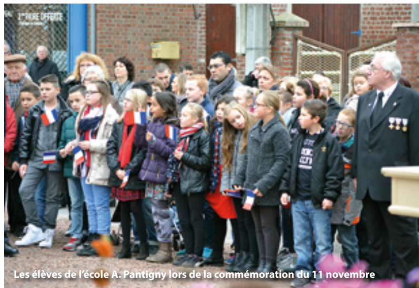
Les élèves de l'école A. Pantigny lors de la commémoration du 11 novembre

Conseil Municipal des Jeunes ont tenu entre leurs mains la flamme du souvenir. Tous ont ensuite défilé, accompagnés par la population, vers le monument aux morts où les écoliers ont entonné la Marseillaise. Monsieur le Maire a rappelé qu'« Au cœur de l'enfer glacial des tranchées, nos «Poilus» nous ont donné une exceptionnelle leçon de dévouement, de dépassement, d'humanisme et de fraternité. Pour notre Nation, ces hommes et ces femmes, mobilisés à l'arrière du front n'ont jamais cessé d'animer, même aux pires moments, le feu de la liberté et de l'espérance, et la promesse de lendemains heureux. Le 11 novembre puise toute sa signification dans l'absolu devoir de mémoire que nous devons pérenniser et devient, sans rien retirer aux autres jours de commémoration, le jour de