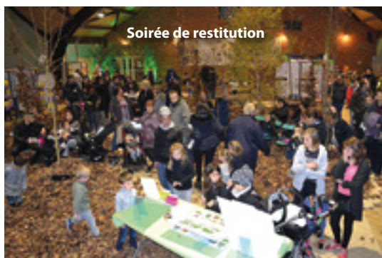
Soirée de restitution