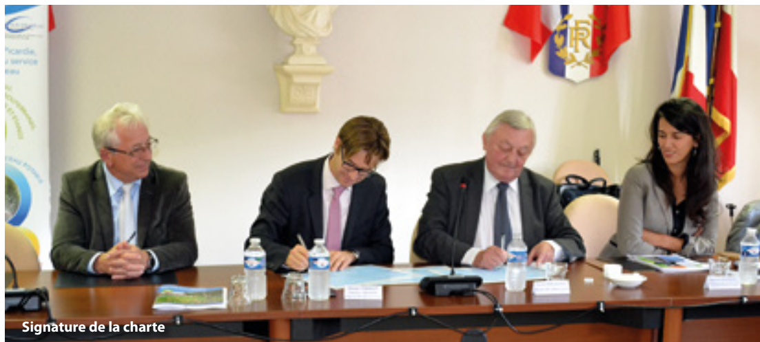
Signature de la charte

Le développement durable consiste à répondre aux besoins du présent sans compromettre la capacité des générations futures de répondre aux leurs. C'est ainsi que sont mises en place à Libercourt des méthodes alternatives de gestion des eaux pluviales lors des rénovations des quartiers, mais aussi une gestion réfléchie des espaces naturels (bois et étangs) avec le soutien technique de partenaires tels que la régie de quartier Impulsion, Eden 62 ou encore l'Office National des Forêts. La ville de Libercourt réalise également différentes actions pédagogiques notamment auprès des écoles dans le but d'habituer les enfants, dès le plus jeune âge, à des comportements raisonnés et responsables.