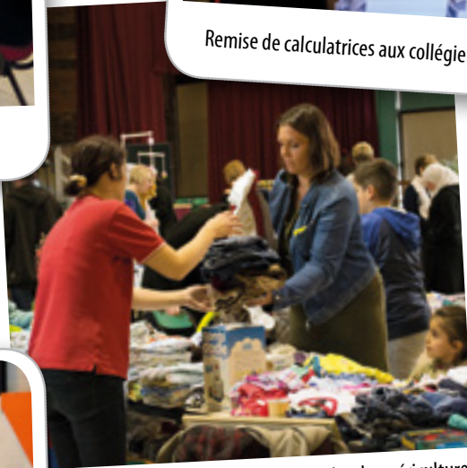
Bourse aux jouets et articles de puériculture, le 7 novembre