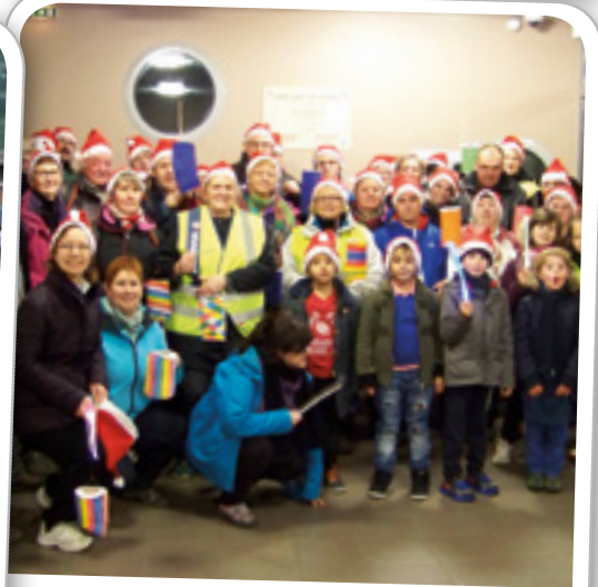
Téléthon par l'association GEA, le 7 décembre