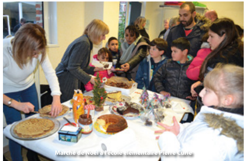
Marché de Noël à l'école élémentaire Pierre Curie