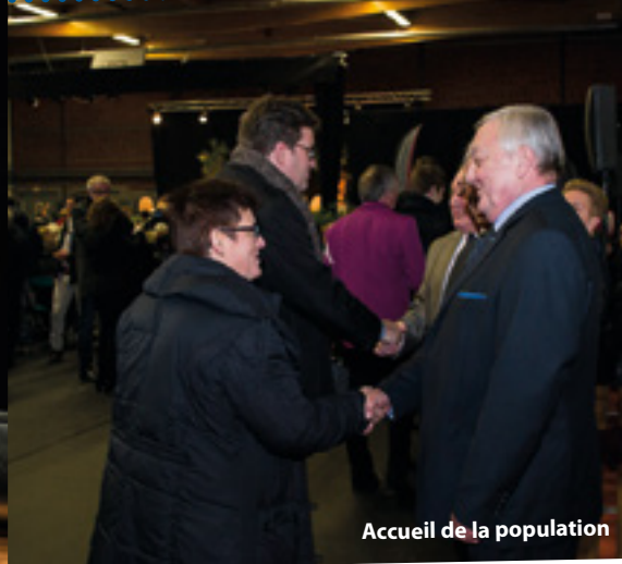
Accueil de la population