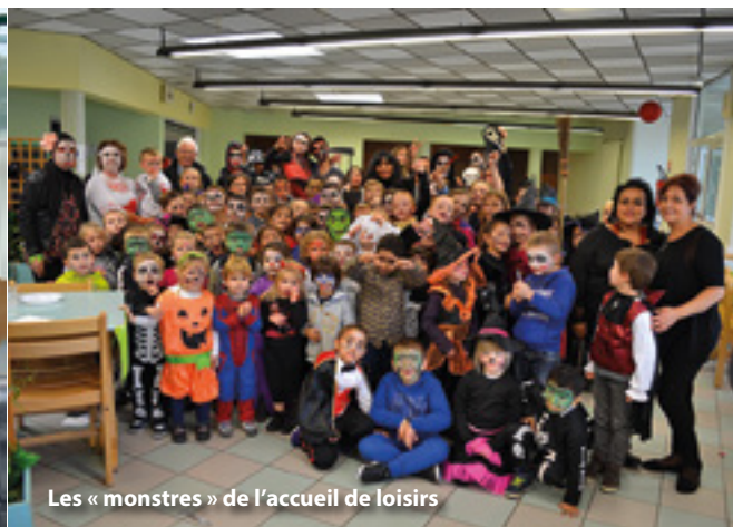
Les « monstres » de l'accueil de loisirs