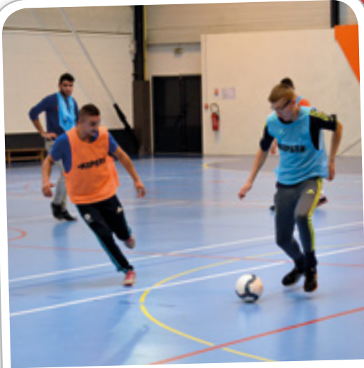
Tournoi de football inter jeunes, le 22 octobre