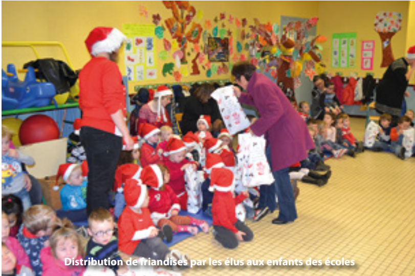
Distribution de friandises par les élus aux enfants des écoles