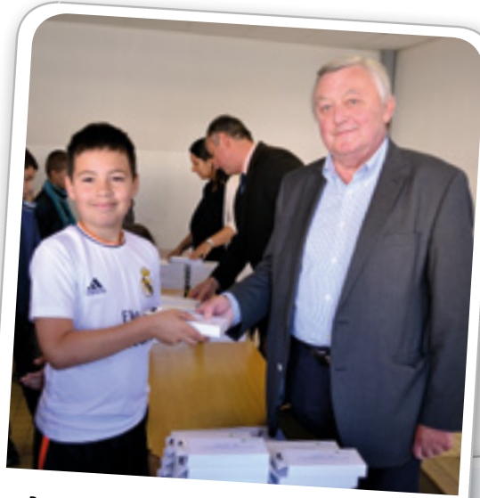
Remise de calculatrices aux collégiens, le 15 septembre