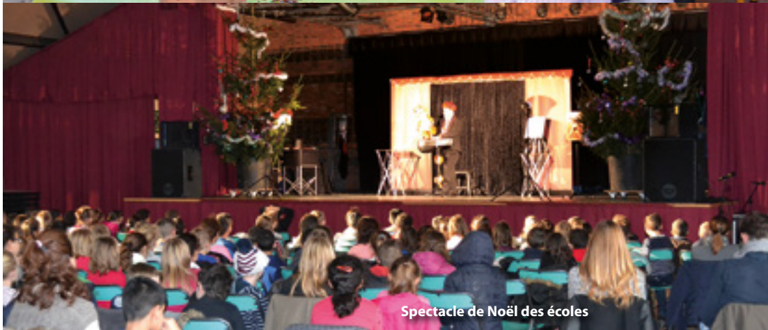
Spectacle de Noël des écoles