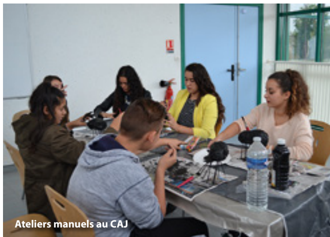
Ateliers manuels au CAJ

Les enfants de l'Accueil de loisirs et du Centre Animation Jeunesse ont profité de nombreuses activités pendant les vacances de Toussaint. Autour de la thématique d'Halloween, les enfants et ados ont réalisé des citrouilles lumineuses ou encore des sorcières en pâte à mâcher. Les jeunes du CAJ ont même eu la chance de fêter Halloween au parc Astérix.