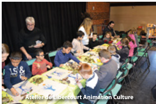
Atelier de Libercourt Animation Culture

Dans une salle Delfosse qui a pris des allures de forêt enchantée, de nombreux travaux manuels réalisés par les enfants des écoles ont été présentés au public. Les élèves ont eu l'occasion de se rendre à Aquaterra mais aussi de participer aux ateliers grâce aux différents partenaires présents comme Eden 62 ou encore les associations Libercourt Animation Culture et l'ASPAD. Ces dernières ont proposé aux enfants de réaliser des arbres en papier ainsi