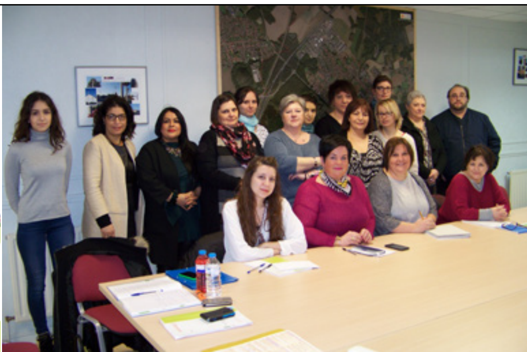
Les agents recenseurs qui passent chez vous depuis le 21 janvier et jusqu'au 20 février prochain.