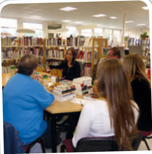
Réunion Tupperware™ littéraire du 12 septembre