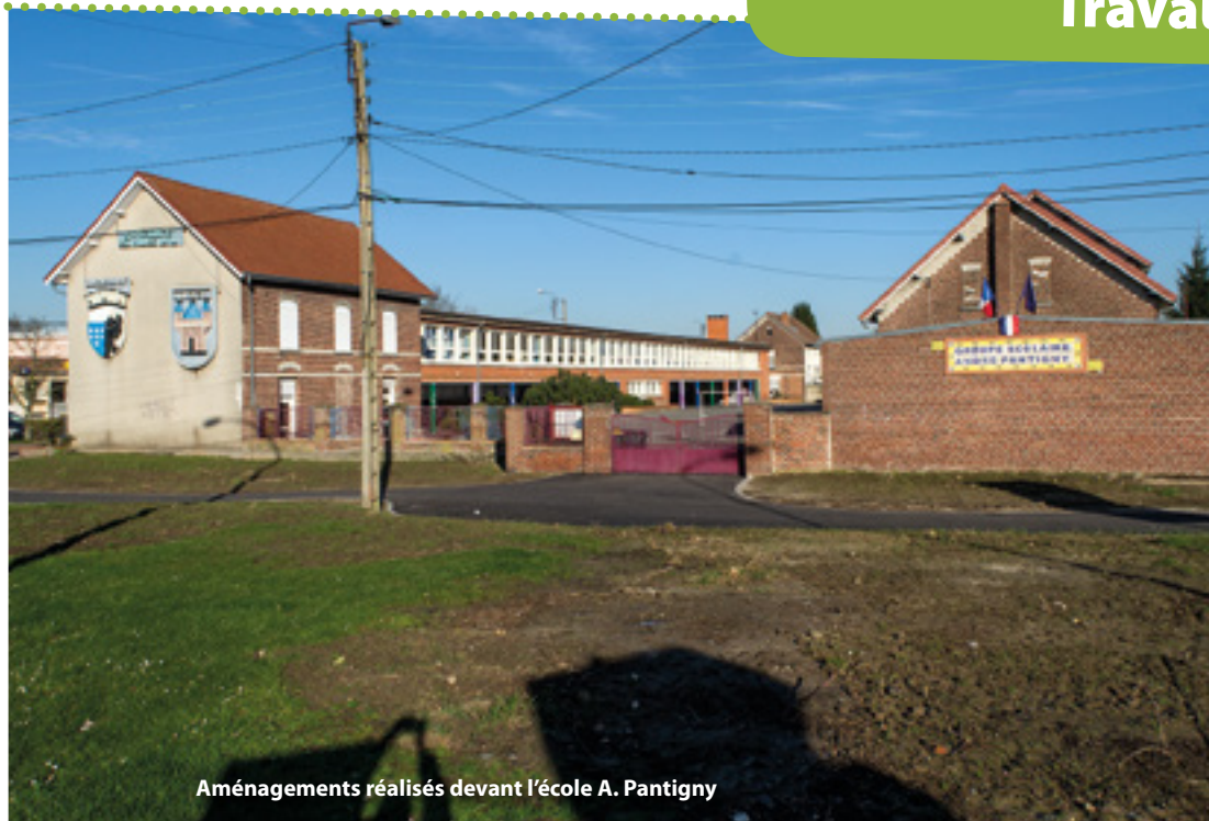
Aménagements réalisés devant l'école A. Pantigny

Vous avez sans doute constaté la présence de travaux devant l'école élémentaire Pantigny ces dernières semaines. En effet, la municipalité a décidé de donner naissance à un nouveau square à cet emplacement. Les travaux de réfection de la rue Allende sont l'occasion de procéder au réaménagement paysager de cet espace, situé dans son prolongement. Sa réalisation a été confiée aux services techniques de la ville et comprendra également l'installation d'un nouveau mobilier urbain.