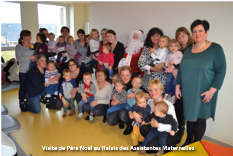
Visite de Père Noël au Relais des Assistantes Maternelles