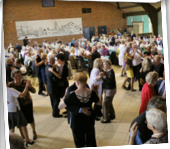
Repas des aînés du 4 octobre