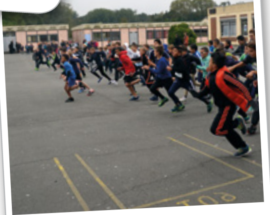
Cross du collège, le 15 octobre