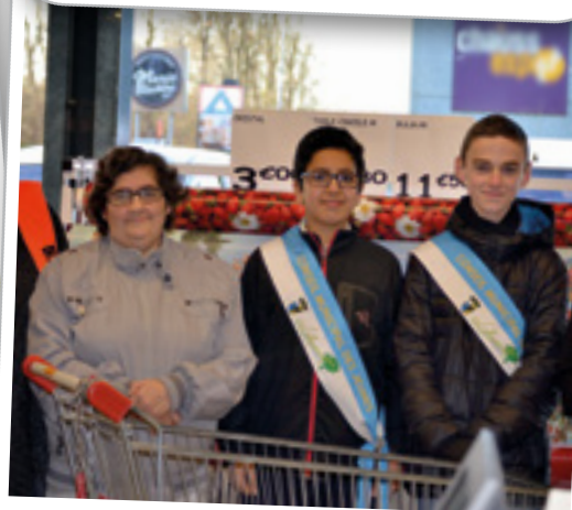
Collecte de la banque alimentaire, le 28 novembre