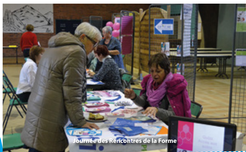
Journée des Rencontres de la Forme

Plusieurs actions autour de la santé ont aussi été proposées durant la semaine bleue. En partenariat avec la CARMi FILERIS, les aînés ont bénéficié d'un dépistage auditif. Une journée « rencontres de la forme » a permis d'échanger avec des professionnels présents toute la journée pour les renseigner sur les accompagnements proposés sur le territoire ou les conseiller en terme d'activité physique adaptée ou de nutrition. Des outils afin d'évaluer ses capacités ou maintenir au mieux son capital santé ont aussi été proposés. Pour clôturer cette semaine, les aînés se sont retrouvés pour participer à une marche bleue dans la ville, l'occasion de réaliser une activité physique douce mais qui a de nombreux bienfaits.