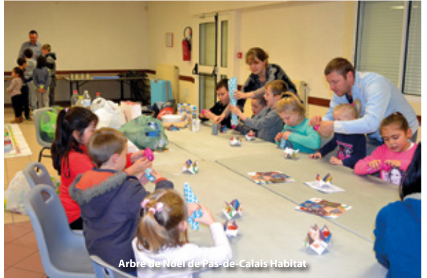
Arbre de Noël de Pas-de-Calais Habitat