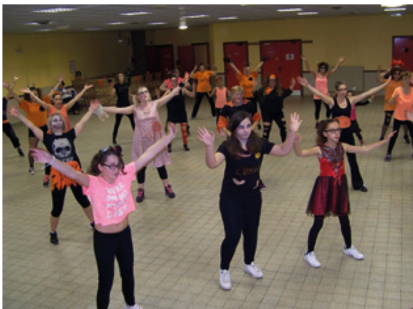
Liberty Fun fête Halloween!