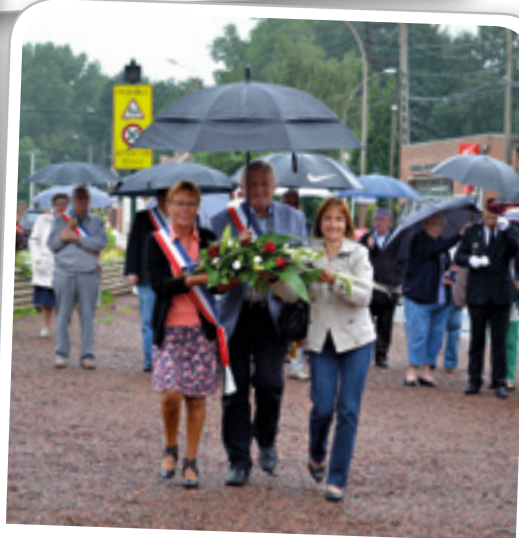
Commémoration de la libération de Libercourt, le 2 septembre