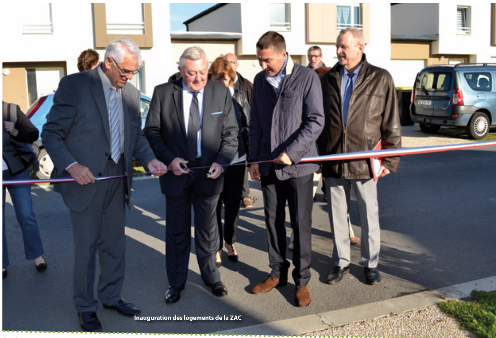
Inauguration des logements de la ZAC

la phase d'accession, mais aussi une garantie de relogement en cas de difficultés financières, une garantie de rachat durant les premières années, sans perte de valeur et des frais de notaires réduits pour les acheteurs.