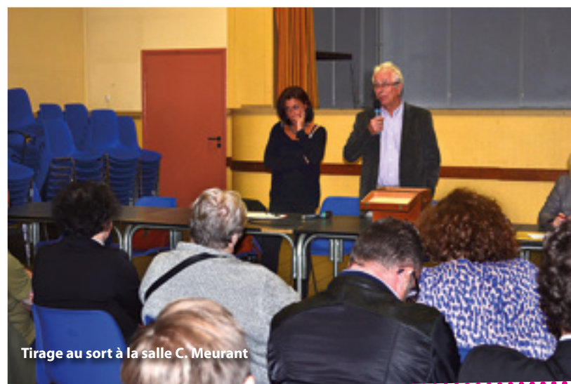
Tirage au sort à la salle C. Meurant

Haute voie car il se situe en zone prioritaire définie par l'Etat. Les membres de ce conseil citoyen seront associés à la décision publique et pourront être force de proposition. Ils seront sollicités sur les questions de cohésion sociale, de développement de l'activité économique, de l'emploi, de cadre de vie et de renouvellement urbain.