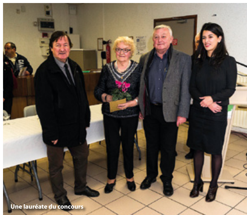
Une lauréate du concours

Parce qu'ils embellissent leur quartier et améliorent le cadre de vie local, parce qu'ils entretiennent la réputation de la ville, qualifiée de « Cité jardin », et ses deux fleurs obtenues au concours régional des villes et villages fleuris, ces hommes et femmes ont été remerciés comme il se doit et ont ensuite partagé le verre de l'amitié.