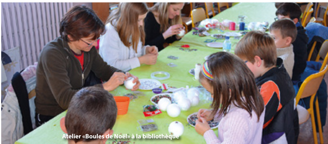
Atelier «Boules de Noël» à la bibliothèque