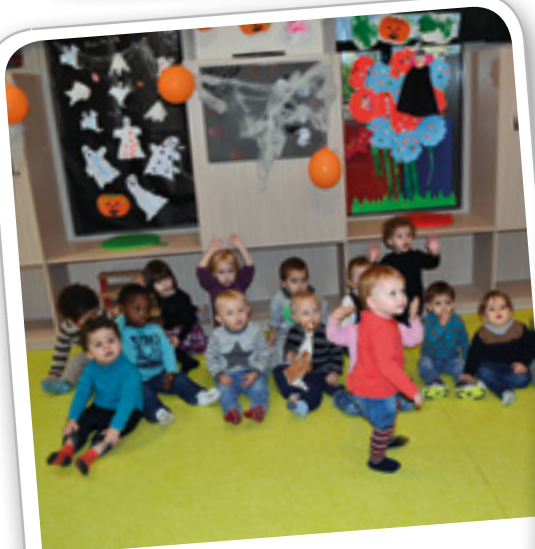
Goûter d'halloween à l'Ilot câlin, le 2 novembre