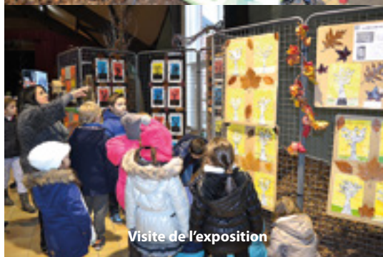
Visite de l'exposition

que différents éléments de la forêt. Un spectacle a été proposé ainsi que la diffusion d'un film. Une soirée de restitution est venue clôturer en beauté ce festival qui contribue, plus que jamais, au bien-vivre ensemble grâce à l'implication des différents partenaires.