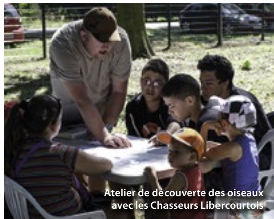
Atelier de découverte des oiseaux avec les Chasseurs Libercourtois