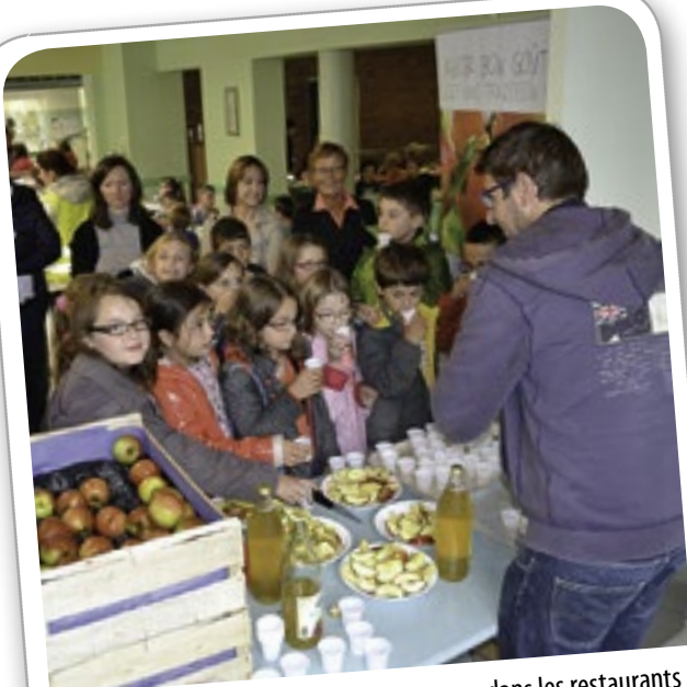
Dégustation de pommes et jus de pommes dans les restaurants scolaires, le 22 juin