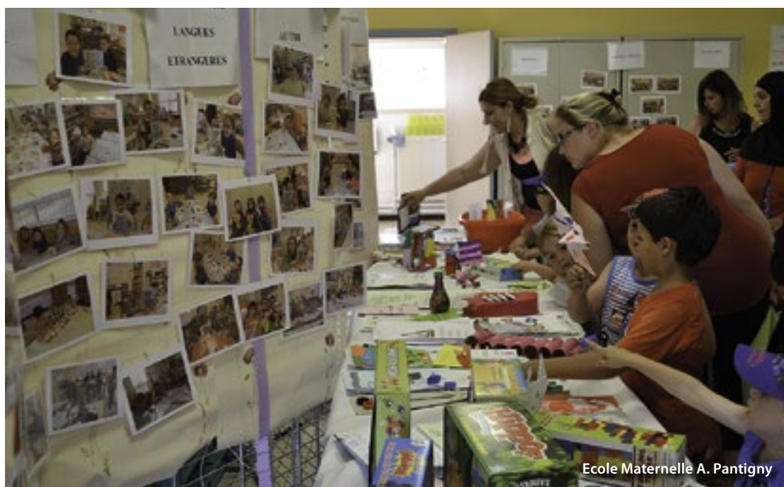
Ecole Maternelle A. Pantigny

« À la rentrée 2016, les Temps d'Activités Péri-scolaires auront lieu le lundi et le jeudi pour le groupe scolaire Pantigny et le mardi et le vendredi pour les groupes scolaires Jaurès