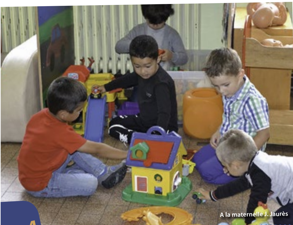
A la maternelle J. Jaurès