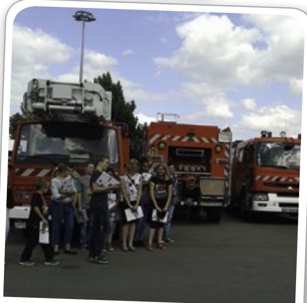
Visite du SDIS par le Conseil Municipal des Jeunes, le 24 juin