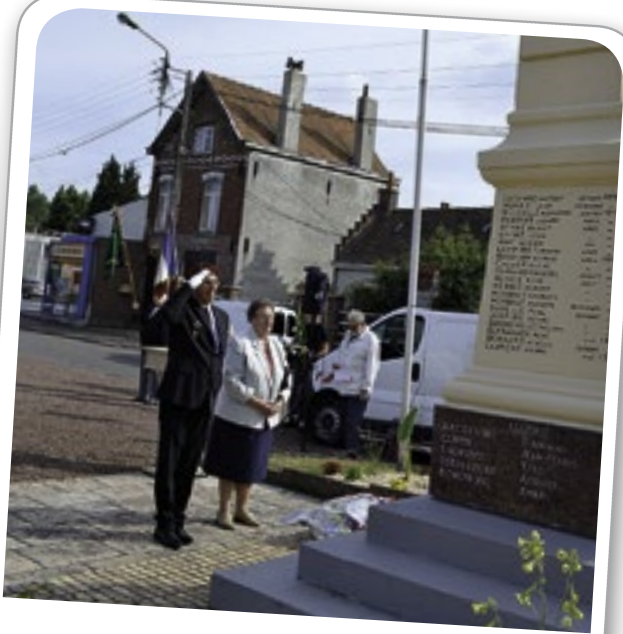
Commémoration de l'Appel du Général De Gaulle, le 18 juin