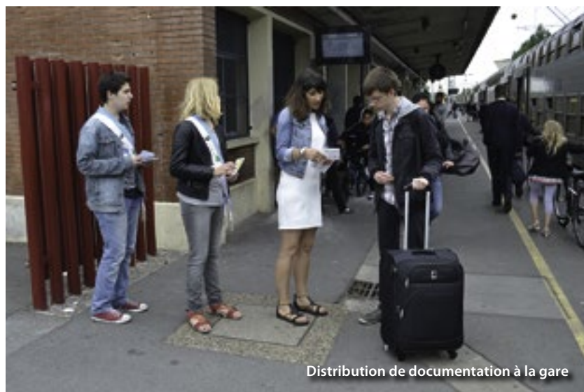
Distribution de documentation à la gare