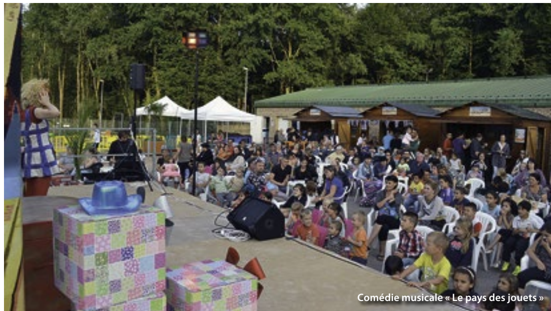
Comédie musicale « Le pays des jouets »