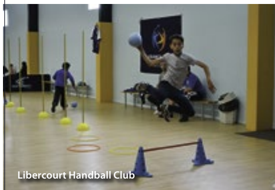
Libercourt Handball Club