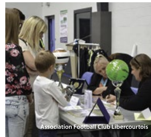
Association Football Club Libercourtois