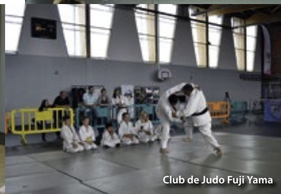
Club de Judo Fuji Yama