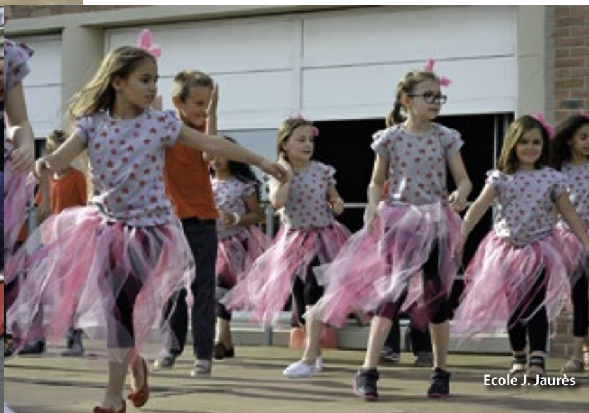
Ecole J. Jaurès