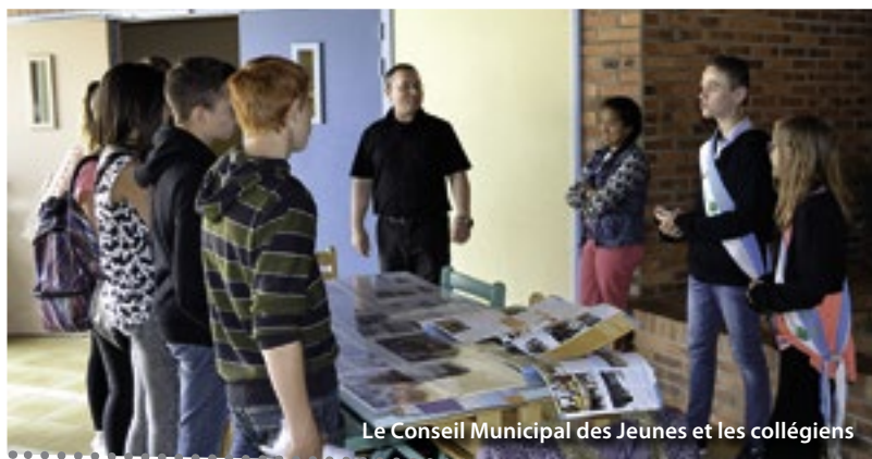
Le Conseil Municipal des Jeunes et les collégiens

les services rendus à la population. Sous la forme d'un jeu de piste, ils ont découvert le PRE (Programme de Réussite Educative), le PIJ (Point Information Jeunesse), le CAJ (Centre Animation Jeunesse) ou encore le PIMMS (Point Information Médiation Multi Services). Nouveauté cette année, les membres du Conseil Municipal des Jeunes étaient là pour présenter leurs missions et même faire naître, peut-être, quelques vocations. Les collégiens se sont ensuite vu remettre des lots et un goûter pour clore cette action.