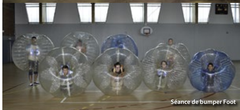
Séance de bumper Foot