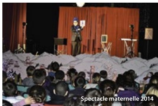
Spectacle maternelle 2014

C'est une tradition que les enfants adorent. Chaque année, à la période de Noël, la municipalité offre un spectacle aux enfants scolarisés dans les écoles maternelles et élémentaires de la commune, pour une valeur totale de 2 500€