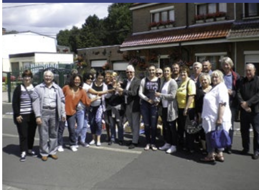
Marché aux puces du CPCL aux Marlières, le 13-06-2015