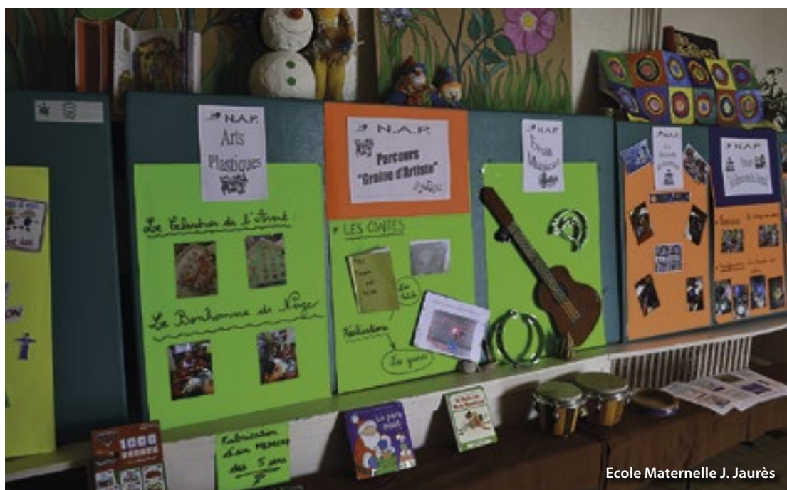
Ecole Maternelle J. Jaurès

et Curie. Les activités proposées évolueront au sein des cinq parcours existants qui cette année seront imposés lors de l'inscription de façon à ce que chaque enfant participe à tous les parcours. Il y aura également quelques mouvements dans le personnel encadrant les activités.»