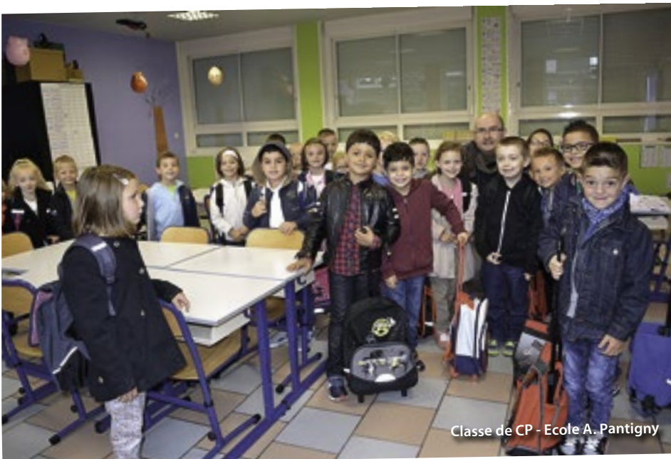
Classe de CP - Ecole A. Pantigny