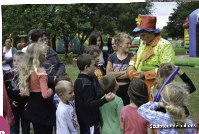
Sculpteur de ballons

Pour clore en beauté cette journée, le bal populaire a fait danser petits et grands et le ciel s'est embrasé avec le traditionnel feu d'artifice.