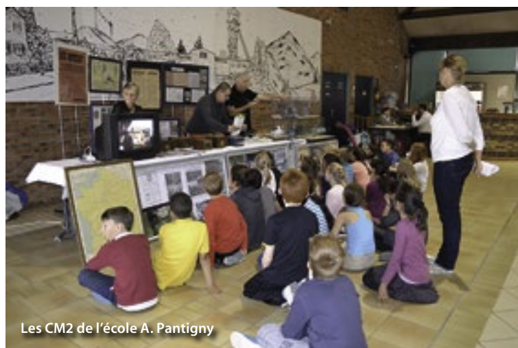
Les CM2 de l'école A. Pantigny