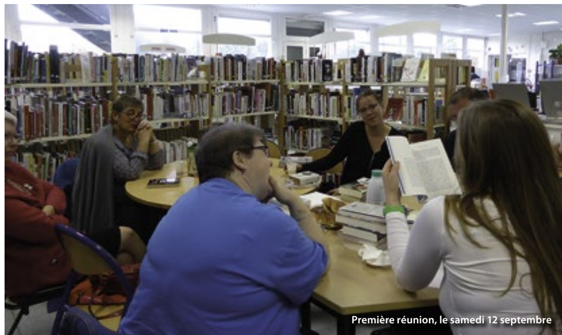
Première réunion, le samedi 12 septembre

Renseignement / inscriptions : 03.21.37.12.58 ou bibliotheque@libercourt.com