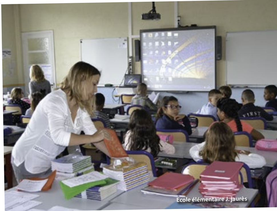
Ecole élémentaire J. Jaurès

Une classe de l'école maternelle Pantigny