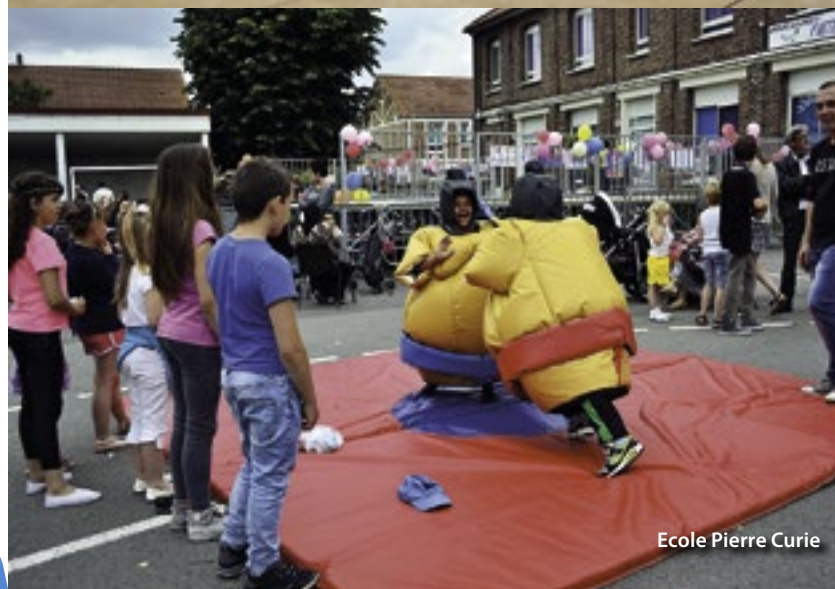
Ecole Pierre Curie

Chaque groupe scolaire de la ville a proposé des animations, en partenariat avec les associations de parents d'élèves. Au programme : spectacles, gourmandises, jeux d'adresse ou encore bataille de sumo, de quoi satisfaire les enfants, mais aussi les parents !