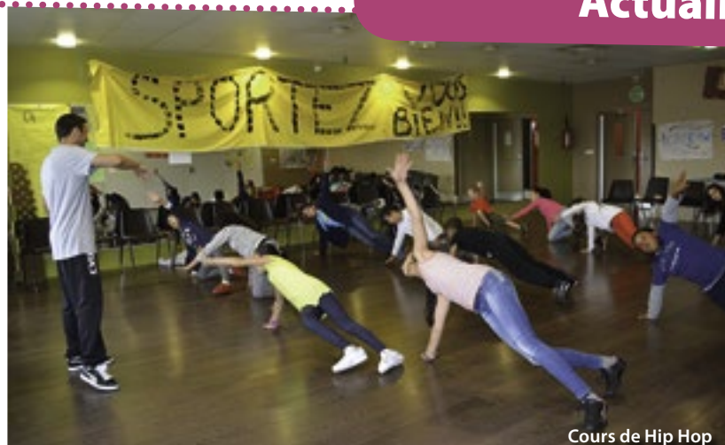
Cours de Hip Hop