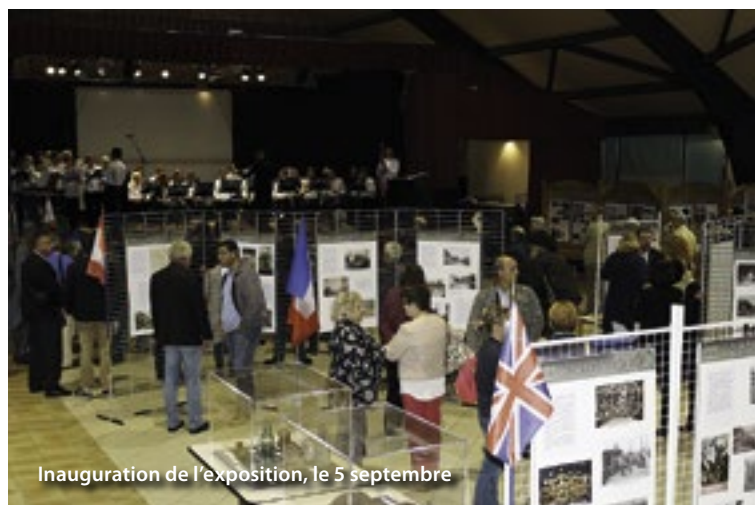
Inauguration de l'exposition, le 5 septembre

Expositions, conférences, projections, spectacles et lectures vous ont fait revivre les joies et les peines de la période 1914-1918.