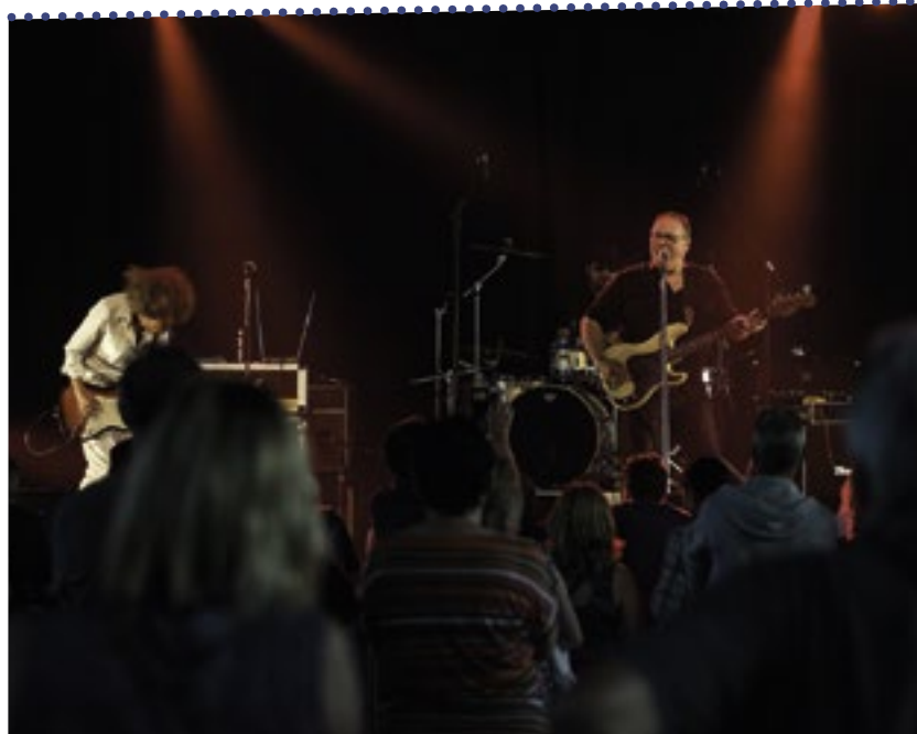
Concert Handirock, le 27-06-2015

À noter que les ingrédients nécessaires à la préparation du repas ont été gracieusement offerts par de nombreux parents et que l'intégralité de la recette a été reversée à l'association.