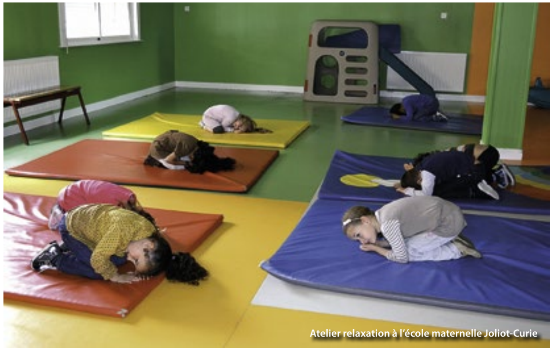
Atelier relaxation à l'école maternelle Joliot-Curie

Le deuxième temps fort s'adressait quant à lui aux enfants. Ils ont participé à différents ateliers comme la relaxation et le yoga, les lectures