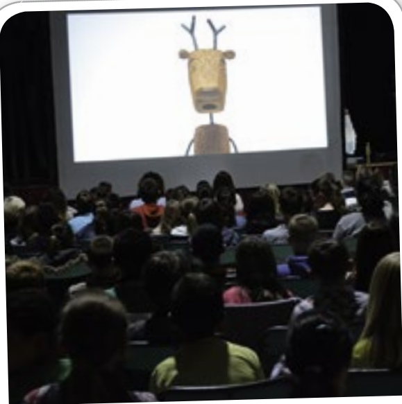
Ciné-Gôûter, organisé par le CAJ, le 19 juin