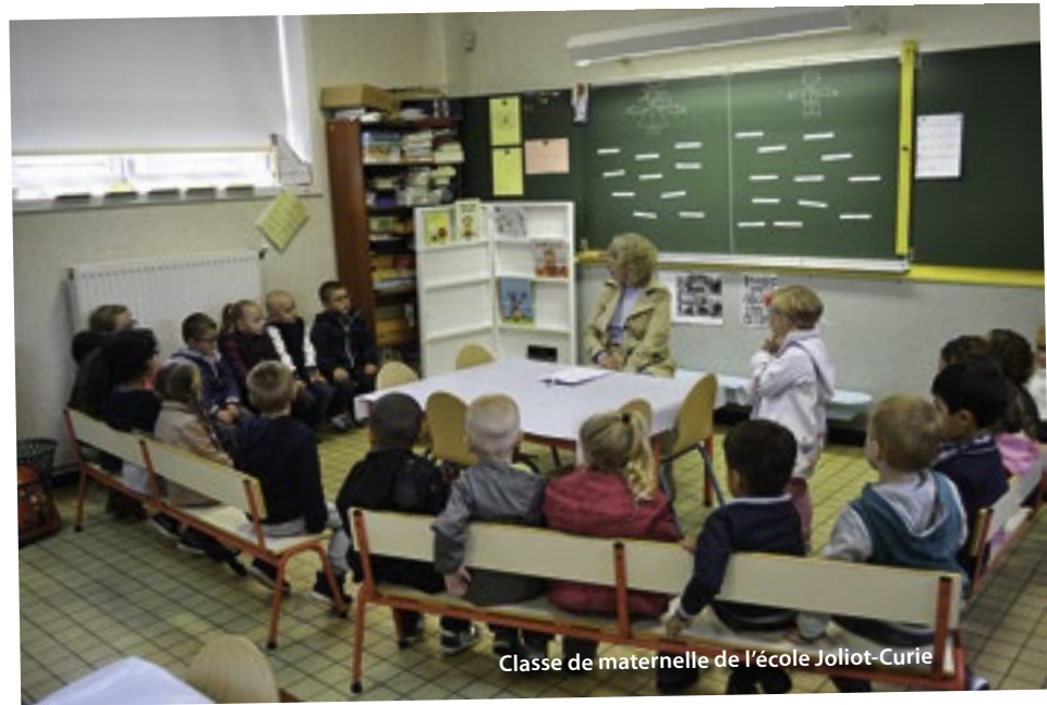
Classe de maternelle de l'école Joliot-Curie