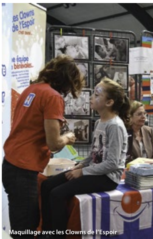
Maquillage avec les Clowns de l'Espoir

Plus de quarante associations ont participé, le samedi 5 septembre au forum des associations organisé par la municipalité. L'occasion pour les libercourtois de découvrir le dynamisme de la vie locale. En cette période de rentrée petits et grands ont pu y trouver l'activité sportive, culturelle ou de loisirs qui sera pratiquée toute l'année à Libercourt. L'occasion aussi pour les associations de se retrouver, de discuter et d'envisager des projets communs !