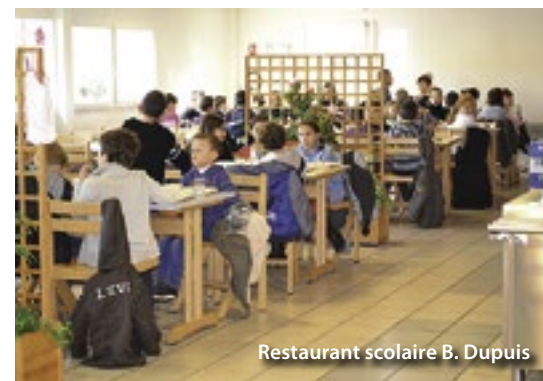
Restaurant scolaire B. Dupuis

Tarifs disponibles sur www.libercourt.com ou au 03 21 08 10 50