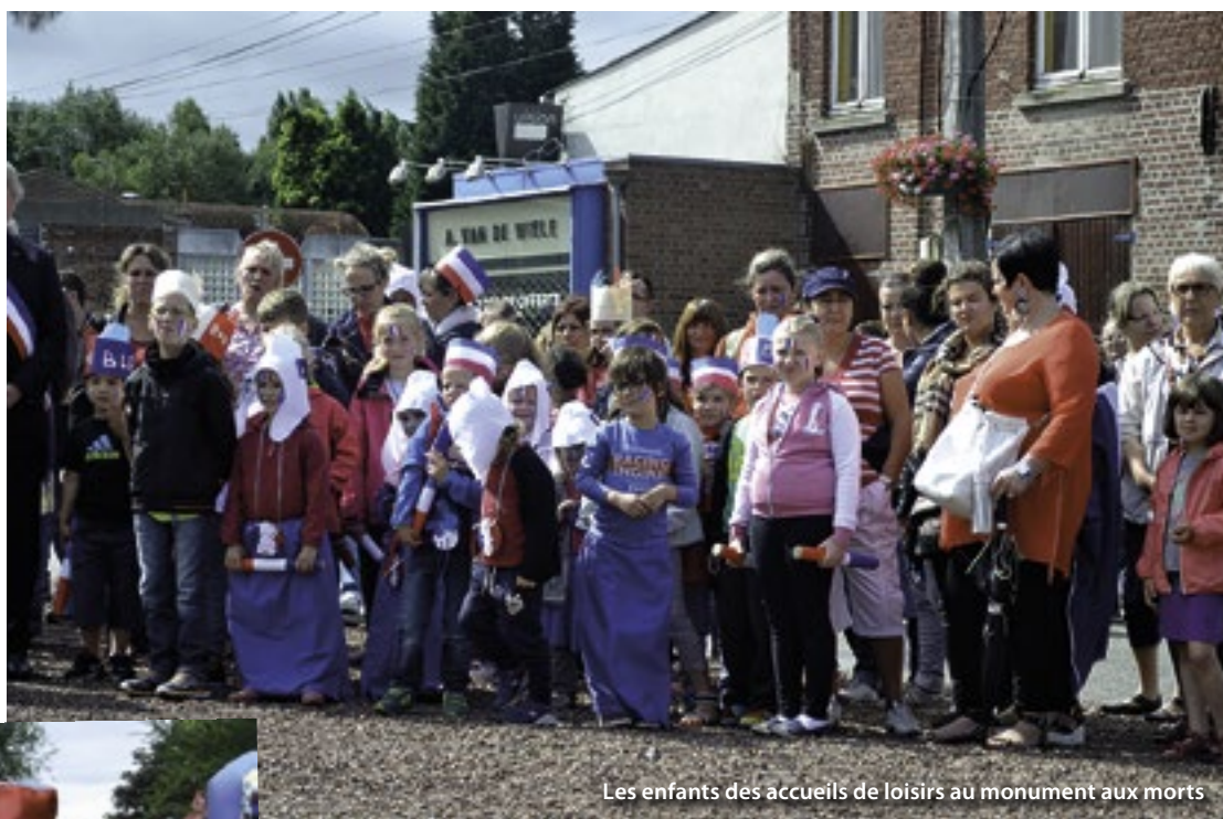
Les enfants des accueils de loisirs au monument aux morts

Ils étaient nombreux ce matin là devant le monument aux morts pour commémorer cette fête nationale : Le Conseil Municipal, les membres du Conseil Municipal des Jeunes, l'harmonie municipale, l'association des anciens combattants et OPEX/ONU/OTAN, les jeunes de l'accueil de loisirs et la population. Tous ont ensuite défilé vers la salle Delfosse. Monsieur le Maire a rappelé qu' « Au-delà de ces temps de mémoire, nous nous attachons tous les jours à traduire en actes, les idéaux républicains. Mais il est aussi essentiel de rappeler que la liberté, l'égalité et la fraternité ne peuvent s'exercer sans responsabilités. La République a créé des droits,