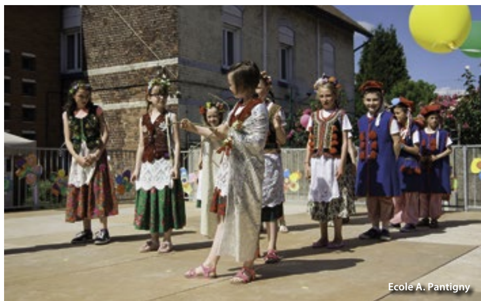
Ecole A. Pantigny

Pour s'inscrire, vous pouvez contacter le CCAS au 03 21 37 23 46.