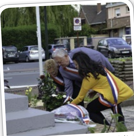
Cérémonie d'hommage aux Morts pour la France en Indochine, le 8 juin dernier