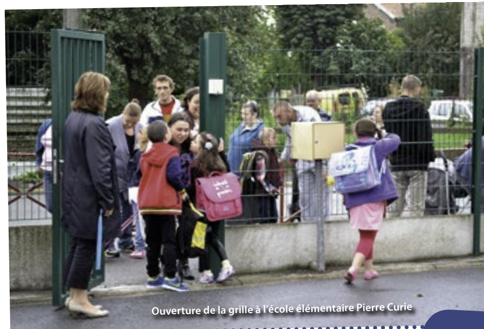
Ouverture de la grille à l'école élémentaire Pierre Curie