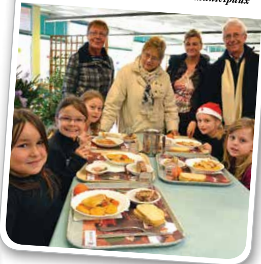
Menu de Noël dans les restaurants municipaux