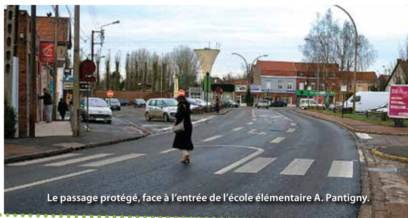
Le passage protégé, face à l'entrée de l'école élémentaire A. Pantigny.