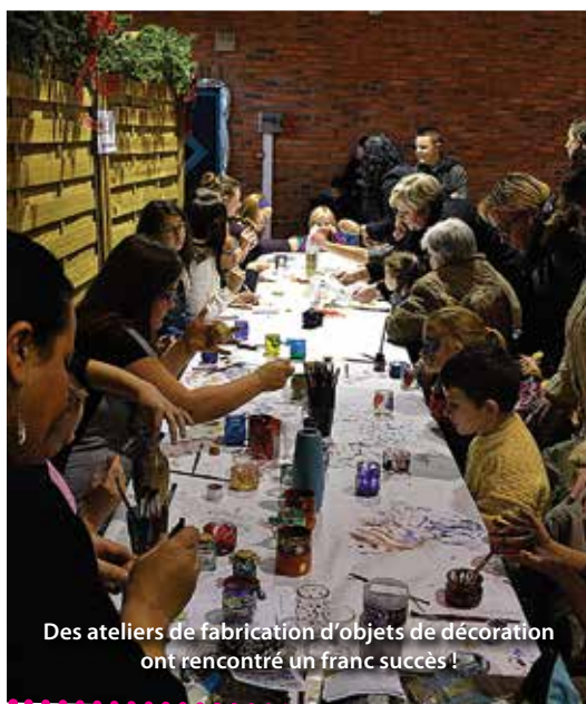
Des ateliers de fabrication d'objets de décoration ont rencontré un franc succès !

L'OMS et les associations sportives libercourtoises se sont associées au marché de la Saint Nicolas pour proposer diverses actions au profit du Téléthon. Buvette, jeux, friandises, élection de Miss Téléthon et un « repas Tartiflette » ont permis à l'OMS de reverser près de 1 328 euros au Téléthon. La comédie musicale « les Jouets de la Fontaine » offerte par la municipalité a conclu cette belle journée du samedi.