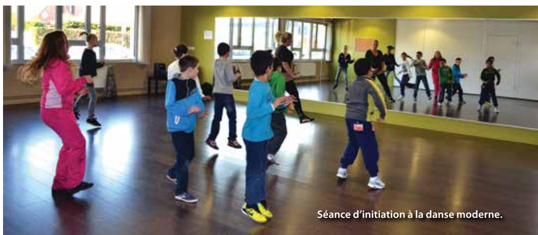
Séance d'initiation à la danse moderne.

Les élèves de cycle 3 (CE2 - CM1 - CM2) des trois groupes scolaires ont pu découvrir pendant une semaine les activités et associations sportives de la commune au complexe sportif Léo Lagrange.