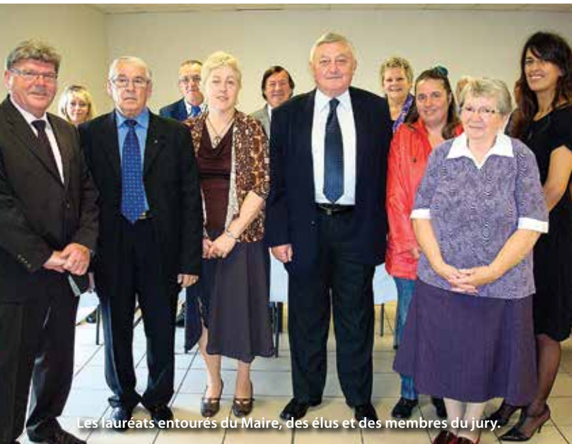
Les lauréats entourés du Maire, des élus et des membres du jury.