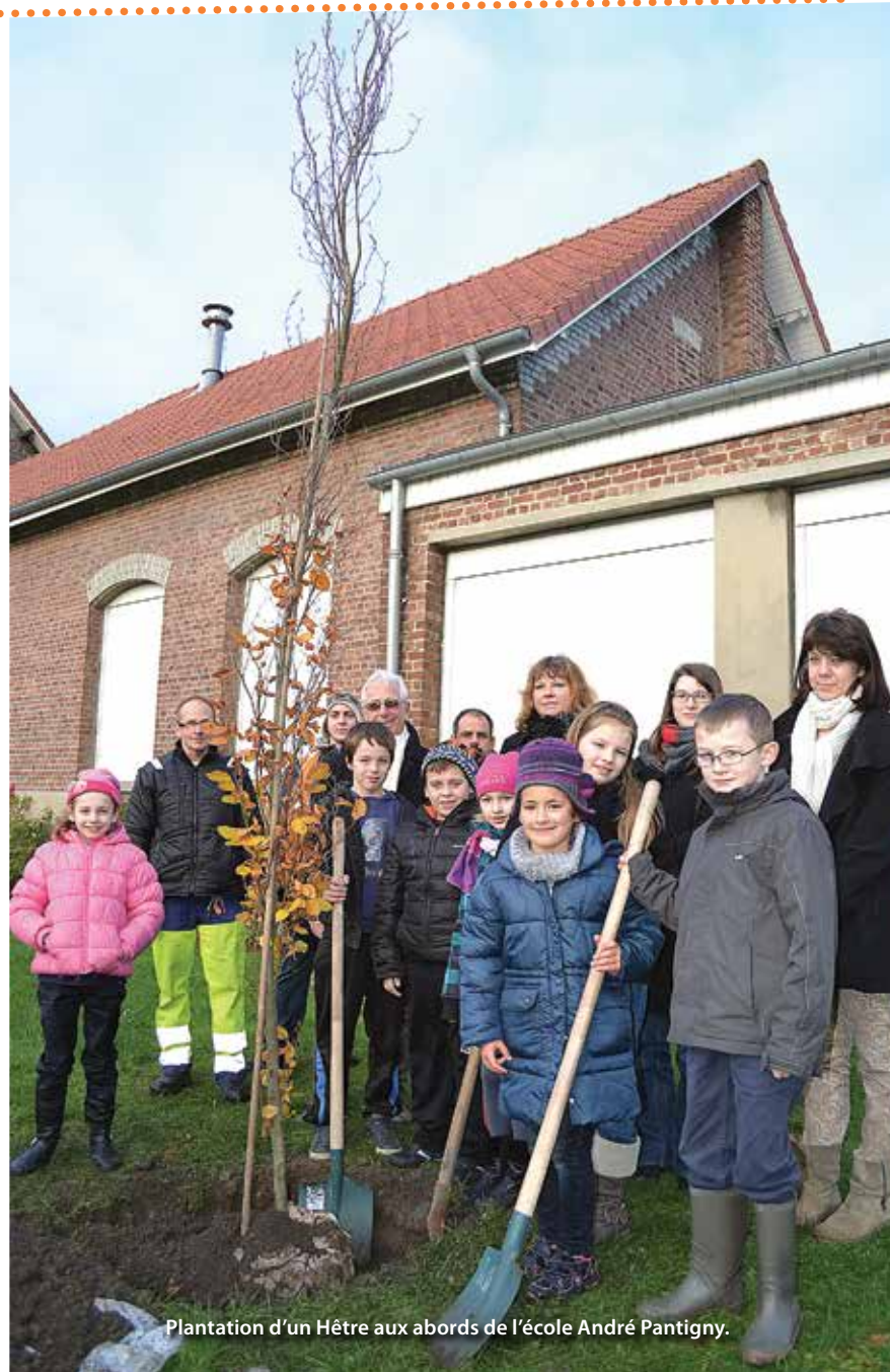
Plantation d'un Hêtre aux abords de l'école André Pantigny.

« Les écoles, Eden 62, la CAHC et les services municipaux se sont beaucoup investis, c'est un partenariat très réussi. Les enseignants ont mené de beaux projets avec les enfants : herbiers, arbre bijoux, exposition photo, jeu en anglais... 180 enfants et adultes ont participé et les enfants des accueils de loisirs ont également été associés. Le spectacle multisupports proposé aux enfants et à l'ensemble des libercourtois était très original et associait l'écran, les bandes son, une conteuse et un musicien. Cette belle opération a également permis aux écoles et Eden 62 d'envisager différents partenariats ».