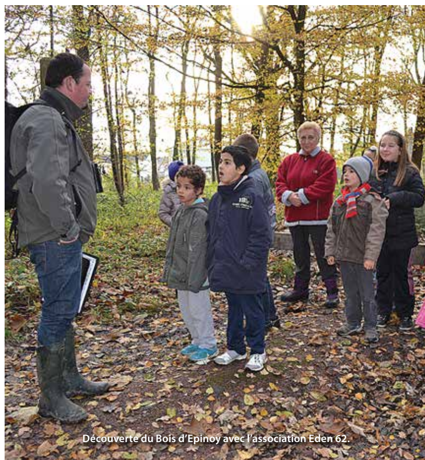
Découverte du Bois d'Épinoy avec l'association Eden 62.