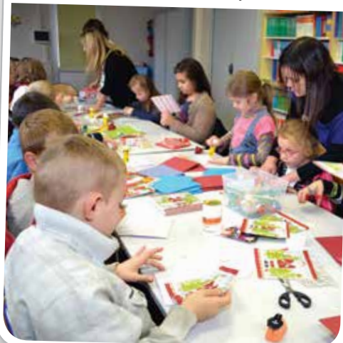
Atelier de création de cartes de voeux à la bibliothèque municipale Raymond Devos