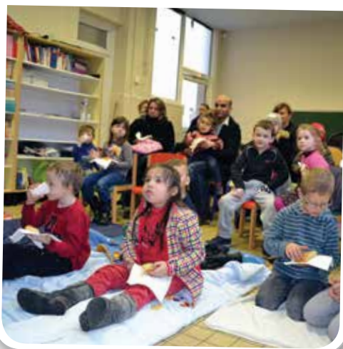
Goûter conté « Galette des rois » à la bibliothèque Raymond Devos