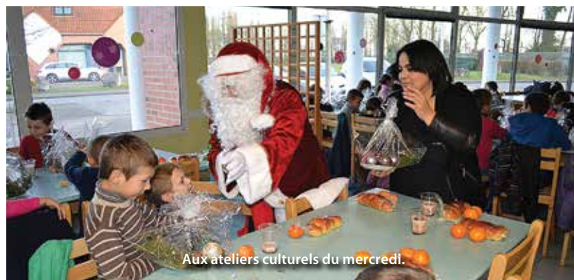
Aux ateliers culturels du mercredi.

Les enfants de la halte-garderie et du centre de loisirs ont également reçu la visite du Père-Noël. « Mais pas le vrai puisque là il est vraiment trop occupé avec les cadeaux » d'après un petit garçon fier devant l'homme à la barbe blanche. La municipalité a proposé deux spectacles aux petits libercourtois. Les élèves des écoles élémentaires ont pu assister au spectacle « Les Mimimos ». Les maternelles ont vu le spectacle « On a volé le père Noël ».