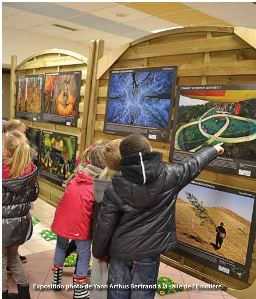
Exposition photo de Yann Artus Bertrand à la salle de l'Émolière.