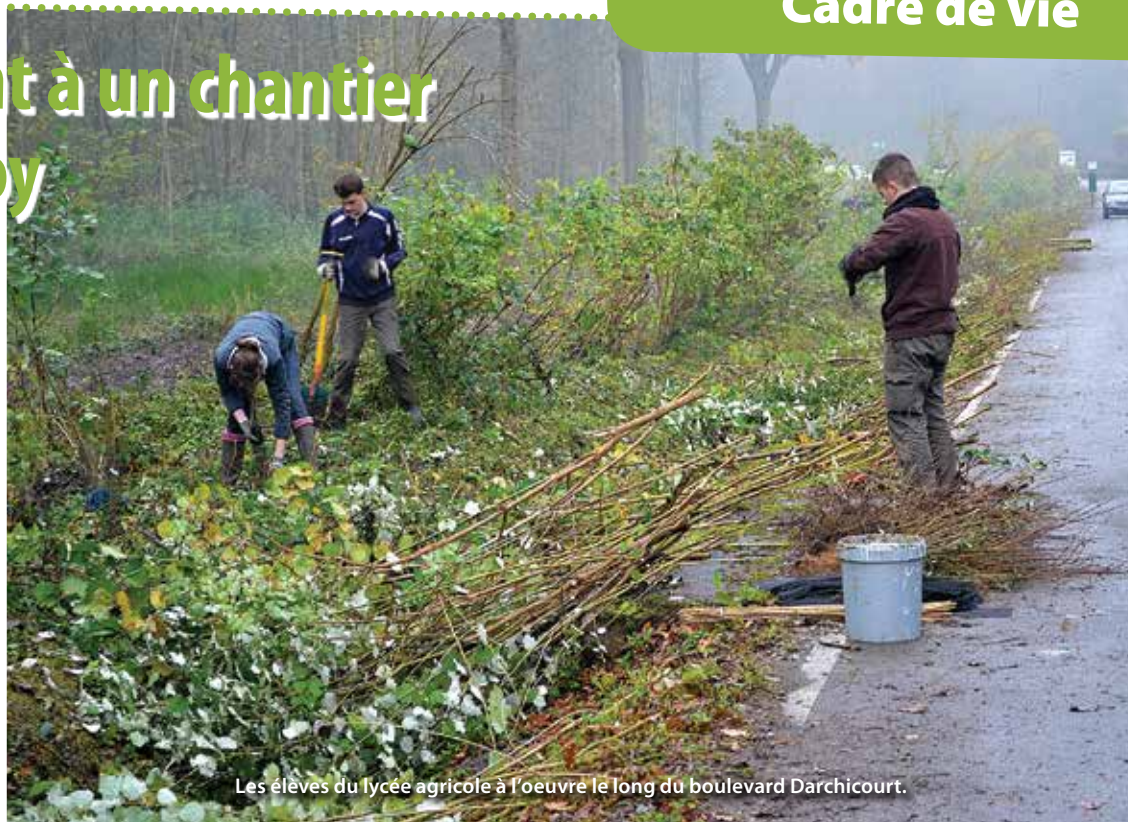
Les élèves du lycée agricole à l'oeuvre le long du boulevard Darchicourt.

La haie de sureau et de cornouillers (arbuste à la teinte rouge), mal en point car étouffée jusque-là par la forêt, a fait l'objet de toutes les attentions. Tailler, débroussailler, replanter telles étaient les missions de ces lycéens à la main verte. Le but était de redonner à cette entrée de ville, dont les libercourtois sont si fiers, le plus beau des visages tout en protégeant les insectes et animaux qui vivent à la lisière du bois.