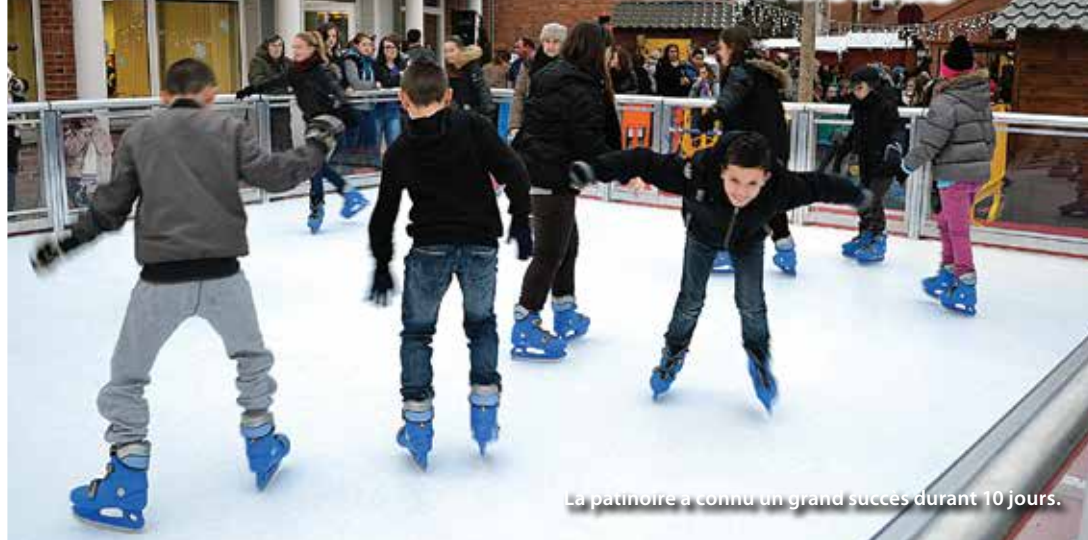
La patinoire a connu un grand succès durant 10 jours.

Le marché de la Saint Nicolas, organisé par le Comité du Personnel Communal de la Mairie de Libercourt (CPCL) en partenariat avec la municipalité et des associations libercourtoises s'est étoffé cette année.