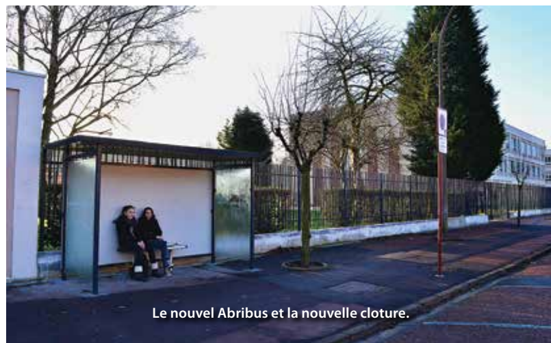
Le nouvel Abribus et la nouvelle clôture.

préfabriqués ont été remplacés et des volets électriques ont été installés dans les salles de cours. Les grilles d'entrée du collège et une partie de la clôture ont également été remplacées. Suite à la demande du Conseil Municipal des jeunes un abribus a été installé à l'entrée du collège. Les collégiens pourront ainsi s'abriter en cas de mauvais temps.