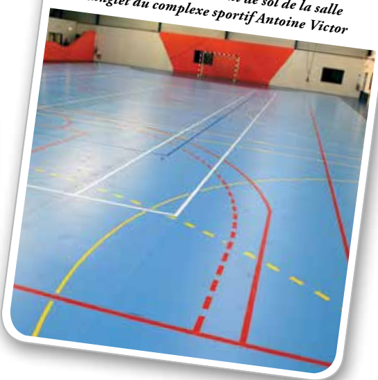
Réfection du revêtement de sol de la salle Langlet du complexe sportif Antoine Victor