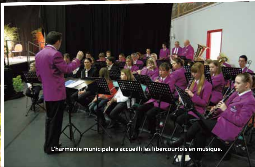
L'harmonie municipale a accueilli les libercourtois en musique.