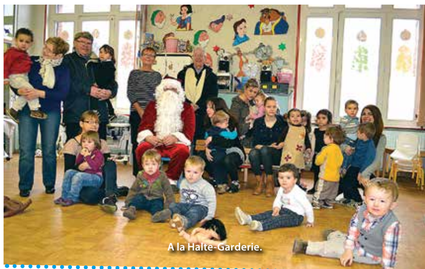
A la Halte-garderie.