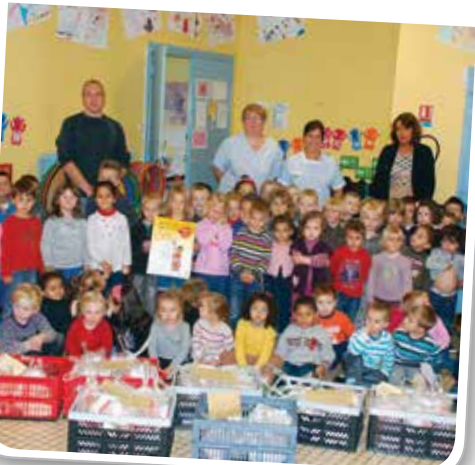
Vente de brioches au profit de l'APEI