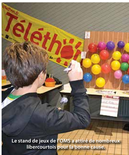
Le stand de jeux de l'OMS a attiré de nombreux libercourtois pour la bonne cause.