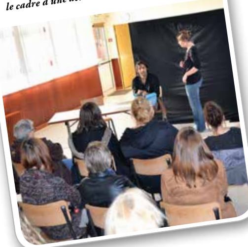
Spectacle « A ta santé » organisé par le CCAS, dans le cadre d'une action de lutte contre le cancer