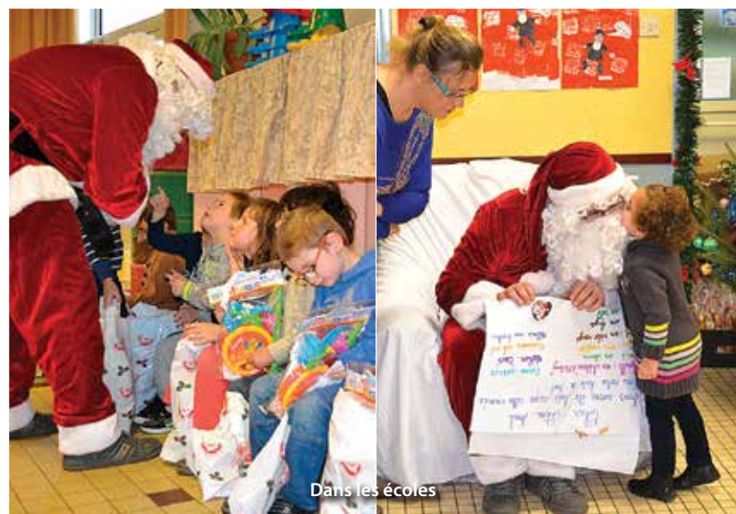
Dans les écoles