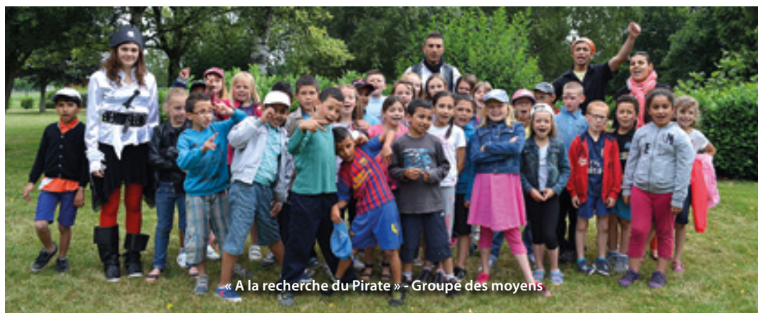
« A la recherche du Pirate » - Groupe des moyens