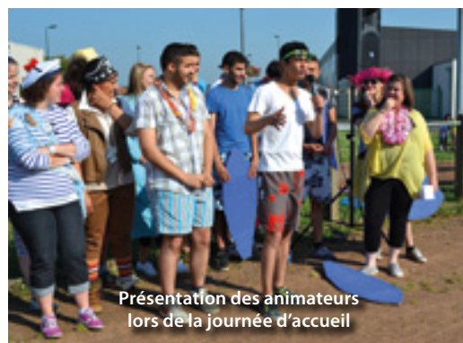
Présentation des animateurs lors de la journée d'accueil