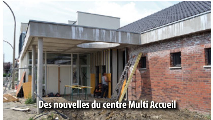
Des nouvelles du centre Multi Accueil

Les travaux sont sur le point d'être achevés. Réalisée en partenariat avec l'ONF, validée par la Direction Régionale de l'Environnement, de l'Aménagement et du Logement Nord - Pas de Calais et financée par le Fonds Européen de Restauration des Milieux Naturels, cette opération répond avant tout à des problèmes de sécurité vis-à-vis du voisinage et des usagers tout en améliorant l'accueil de la faune et de la flore.