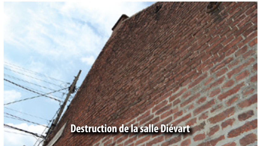
Destruction de la salle Diévert

Les travaux « Cité des bas » touchent à leur fin. Les rues Léonard de Vinci, Eugène Delacroix et Auguste Renoir ont fait peau neuve. Travaux d'assainissement, pose d'un nouveau réseau d'eau potable, éclairage public renouvelé, mise en place du bitume. 5 mois auront été nécessaires pour mener à bien ces travaux.