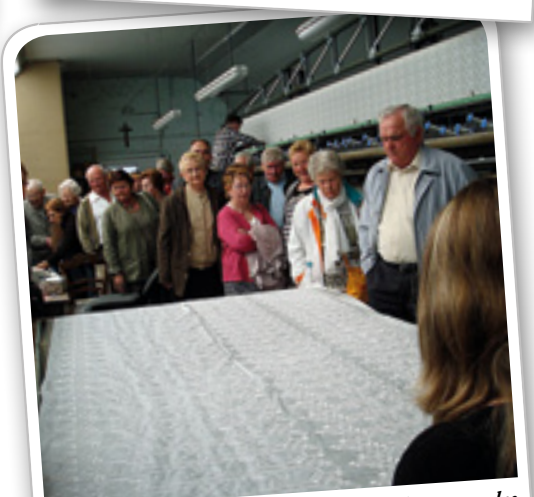
Visite de la Maison de la Broderie lors du voyage des aînés du 3 juin dernier