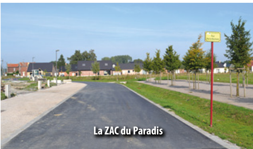
La ZAC du Paradis

Elle est fermée au public depuis plusieurs années. En effet, la mise en conformité de ses installations constituait un coût trop important au regard de la vétusté du bâtiment. Ce bâtiment présente des déformations importantes en façade sur le pignon longeant le chemin piéton situé entre les rues Cyprien Quinet et Paul Pignon. Pour des raisons de sécurité, le bâtiment sera détruit en novembre.