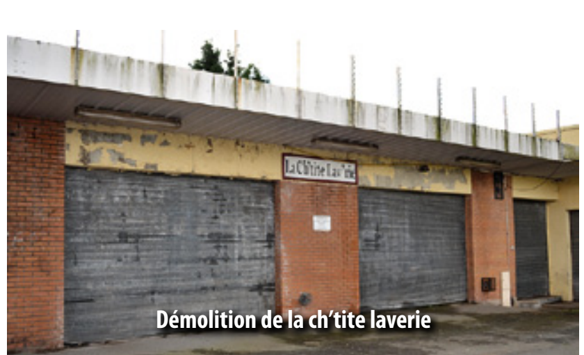
Démolition de la ch'tite laverie

Les travaux ont commencé en 2010 avec une première phase préparatoire qui a consisté à poser les réseaux et la fondation des voiries afin que les lots libres puissent se réaliser sans dégradation des noues et bordures. La deuxième phase de travaux est actuellement en cours. Une trentaine de maisons sont actuellement en construction (accès à la propriété) et les plantations restantes seront installées en novembre.