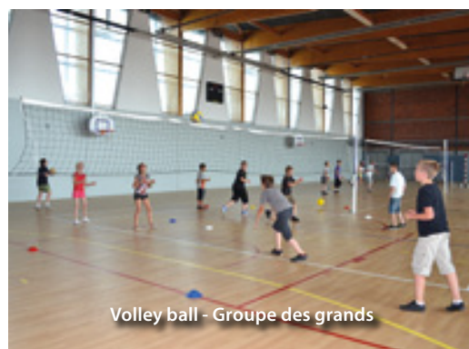
Volley ball - Groupe des grands