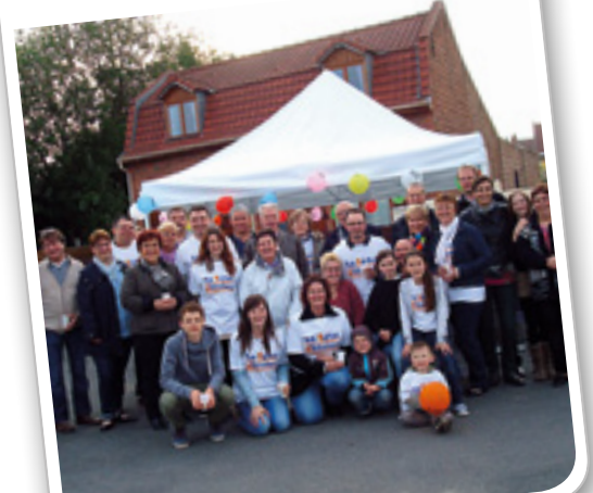
Fête des voisins, le 31 mai dernier