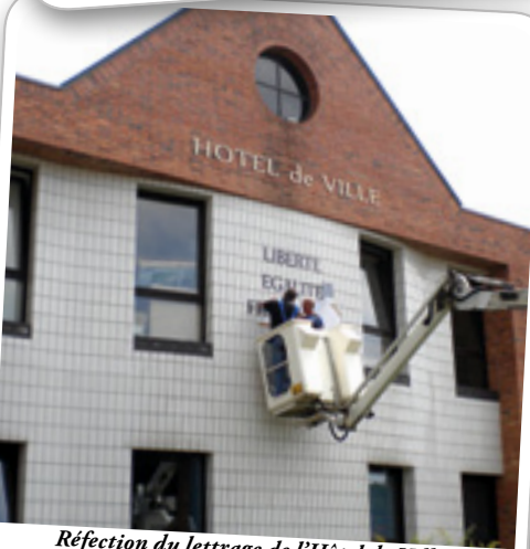
Réfection du lettrage de l'Hôtel de Ville, le 12 juillet