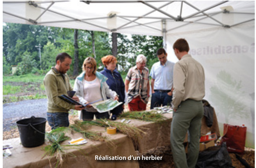
Réalisation d'un herbier

photos ont ainsi été exposées tout au long du parcours du sentier botanique (voir article ci-dessous). Ce dernier a d'ailleurs été inauguré à cette occasion. Le public a également eu un rôle à jouer lors de cet anniversaire : il s'est initié à la conception d'herbiers et a pu assister à des visites guidées du bois d'Epinoy afin d'en apprendre davantage sur les espèces végétales et animales présentes.