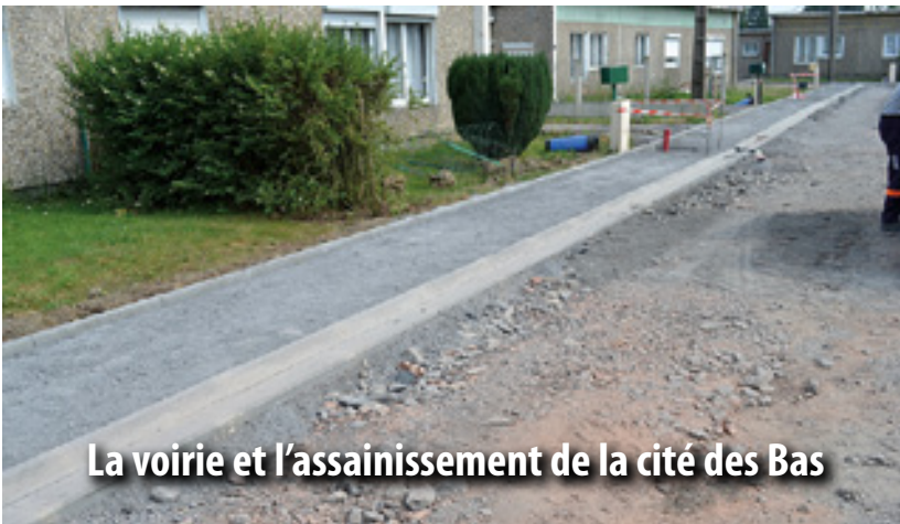
La voirie et l'assainissement de la cité des Bas

Le chantier a débuté en juillet 2012. À la mi-novembre, les travaux de bâtiment seront achevés. Il restera à installer l'ameublement et aménager les abords du site avec notamment une aire de jeux, une aire « dépose minute » ou encore la cour intérieure. L'ouverture du bâtiment est prévue en janvier 2014, si les conditions météorologiques n'entraînent pas des retards dans les travaux.