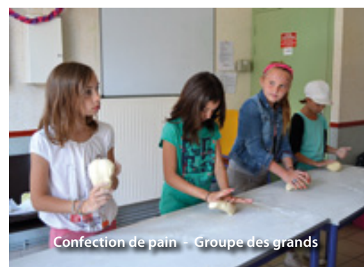
Confection de pain - Groupe des grands