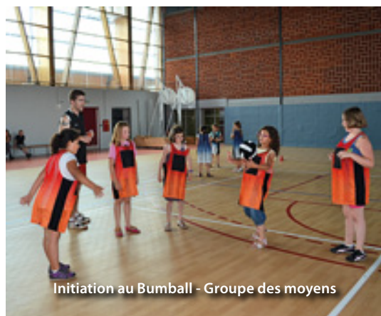
Initiation au Bumball - Groupe des moyens

Jeux, rondes, chants, activités manuelles, balades, sorties et même soleil et bataille d'eau ont occupé les 291 enfants des accueils de loisirs.