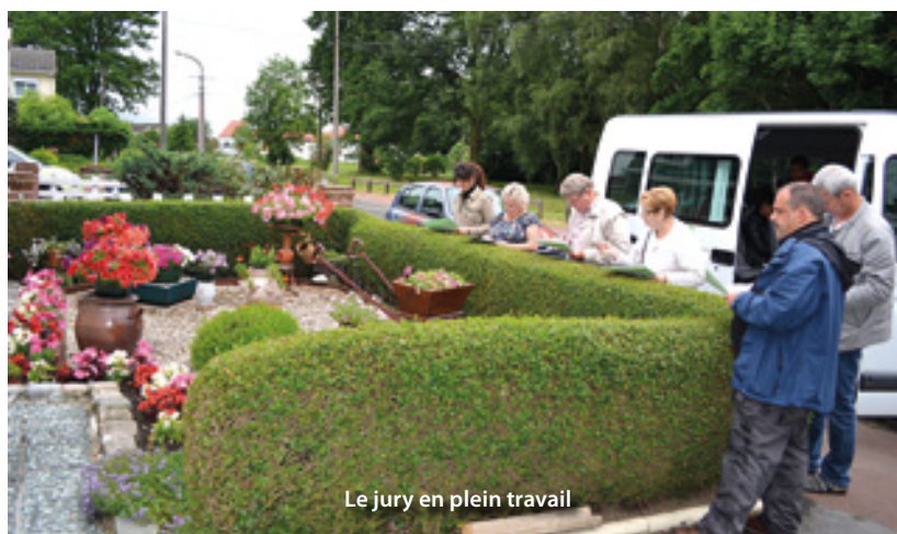
Le jury en plein travail

En est pour preuve les 73 foyers inscrits au concours des jardins, façades et balcons fleuris cette année. Prenant en compte le fait que le froid de l'hiver et du printemps ait retardé la floraison, le jury composé d'élus du Conseil Municipal et du Conseil Municipal des Jeunes ainsi que d'agents des espaces verts est passé le 28 juin. Des maisons superbes, des parterres