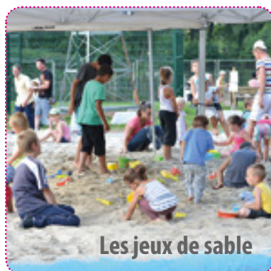
Les jeux de sable