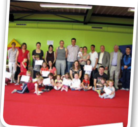
Séance de clôture de la Baby-gym le 8 juin