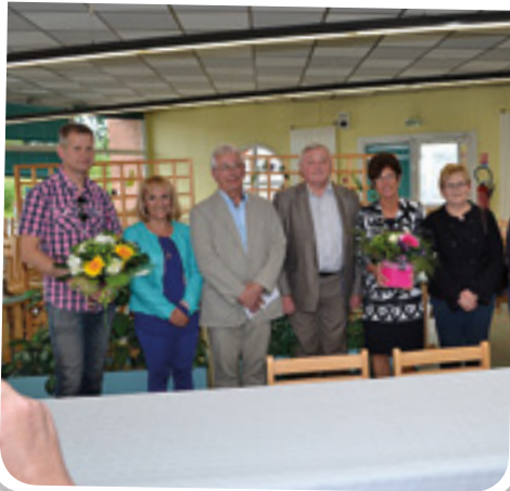
Réception des enseignants le 1 er juillet dernier