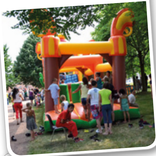
Fête républicaine du 13 juillet