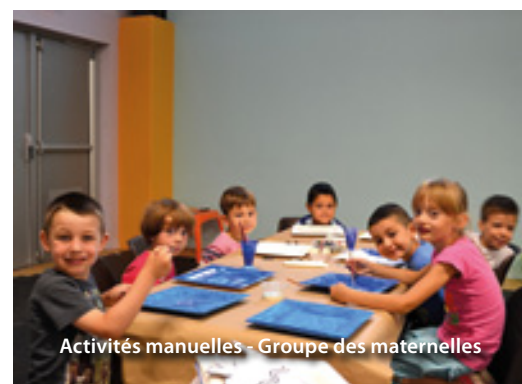
Activités manuelles - Groupe des maternelles