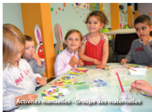
Activités manuelles - Groupe des maternelles