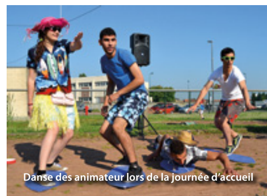
Danse des animateur lors de la journée d'accueil