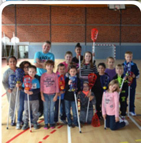
Initiation à la crose québécoise lors de la reprise des accueils de loisirs du mercredi, le 18 septembre