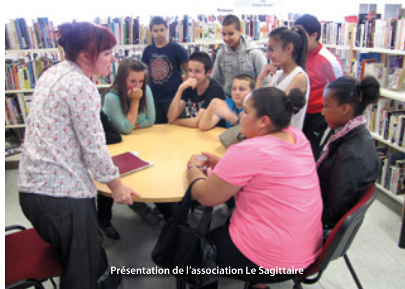
Présentation de l'association Le Sagittaire