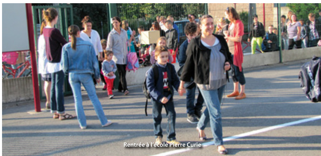
Rentrée à l'école Pierre Curie