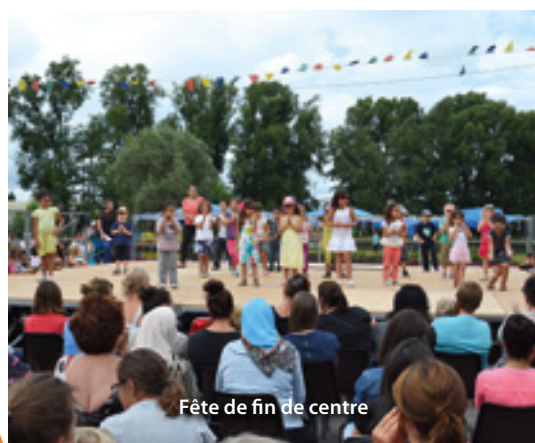
Fête de fin de centre