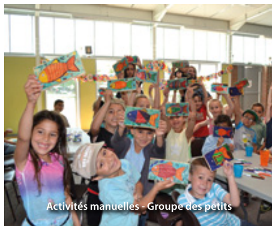
Activités manuelles - Groupe des petits