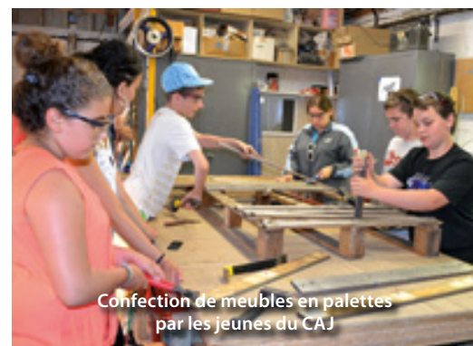
Confection de meubles en palettes par les jeunes du CAJ