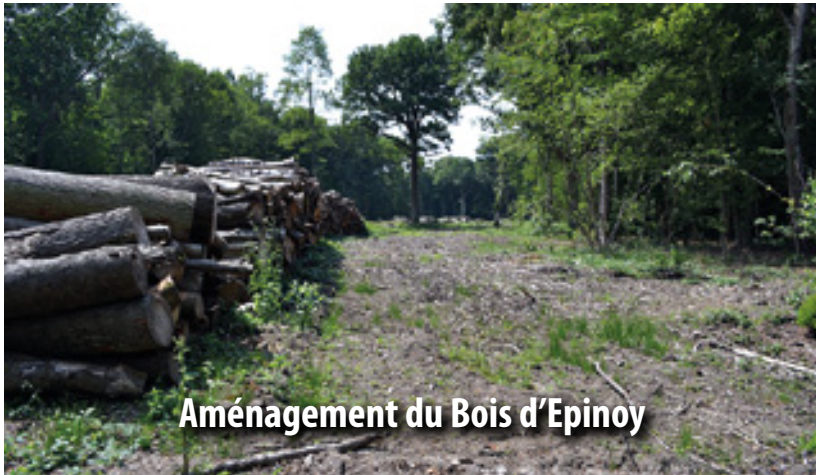
Aménagement du Bois d'Épinoy

Les travaux sont sur le point d'être achevés. Réalisée en partenariat avec l'ONF, validée par la Direction Régionale de l'Environnement, de l'Aménagement et du Logement Nord - Pas de Calais et financée par le Fonds Européen de Restauration des Milieux Naturels, cette opération répond avant tout à des problèmes de sécurité vis-à-vis du voisinage et des usagers tout en améliorant l'accueil de la faune et de la flore.