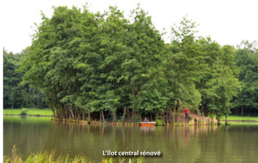
L'îlot central rénové