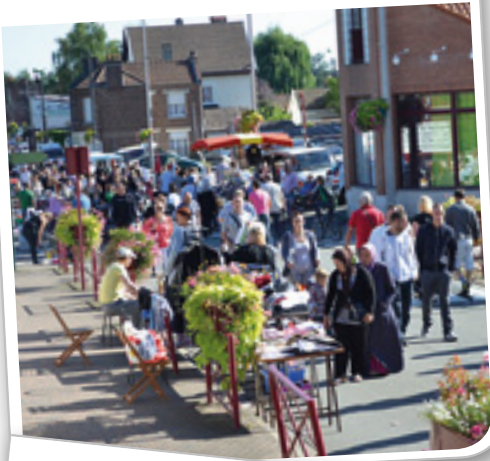
Braderie du centre-ville organisée par la municipalité le 8 septembre dernier