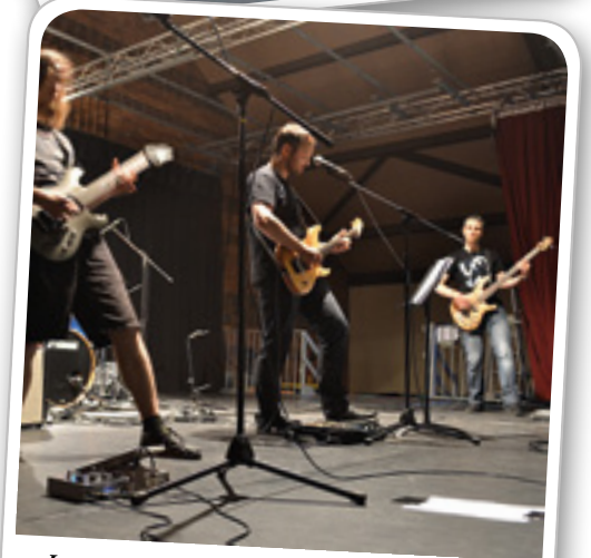
Le groupe Hybrid lors de la fête de la musique, le 21 juin dernier