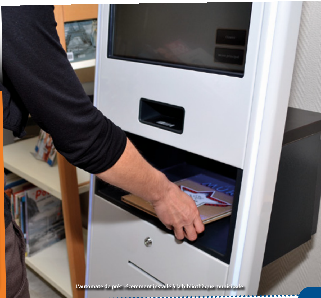
L'automate de prêt récemment installé à la bibliothèque municipale

Informations complémentaires à la bibliothèque au 03 21 37 12 58.