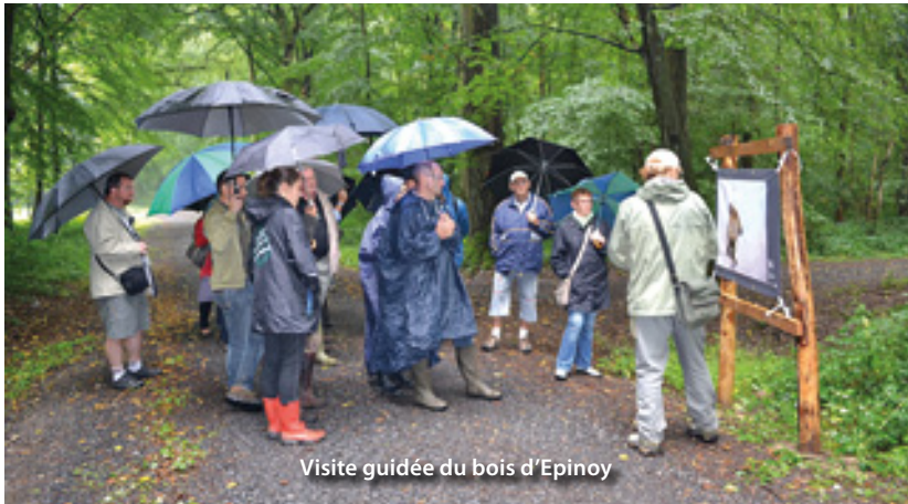
Visite guidée du bois d'Epinoy

au bois d'Epinoy. Malgré une météo capricieuse, les amoureux de la nature ont répondu présent. Le public a ainsi pu découvrir l'exposition photographique, présentant la faune et la flore et issue d'un concours réalisé à l'occasion de cet anniversaire. Une trentaine de