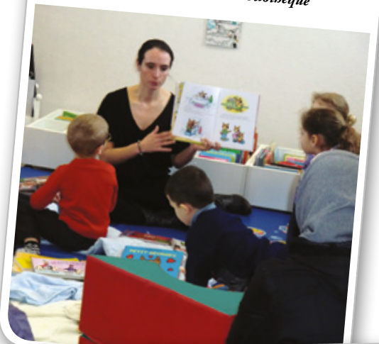
L'Heure du Conte à la bibliothèque