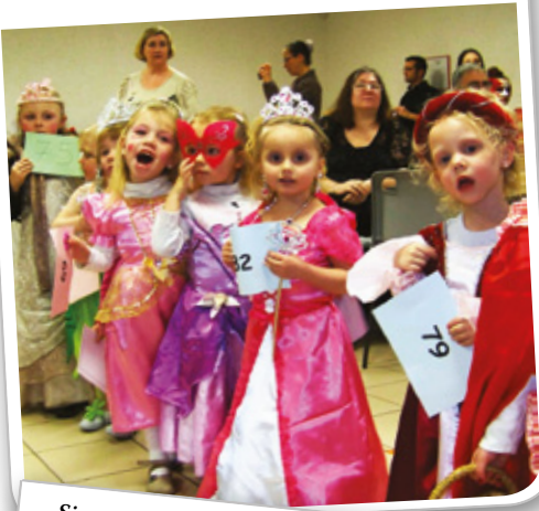
Carnaval de l'école A. Pantigny