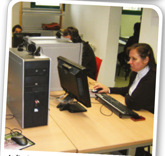
Atelier Parents.Net mis en place au Point Information Jeunesse avec le soutien du PRE