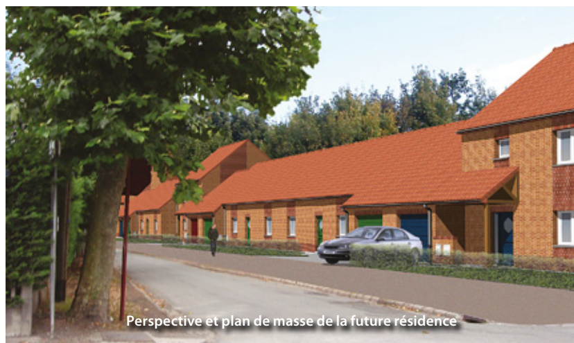
Perspective et plan de masse de la future résidence

pertusions thermiques...). L'orientation et la conception des logements seront optimisées pour favoriser l'éclairage naturel des pièces et l'apport énergétique des rayons du soleil. Ils seront équipés d'une cuve de récupération des eaux de pluie pour l'arrosage et le lavage des véhicules. Le renouvellement urbain reste plus que jamais au cœur de la politique mise en place par la municipalité : « Libercourt sait conjuguer présent et avenir, tout en conservant la mémoire du passé » complète Monsieur le Maire.