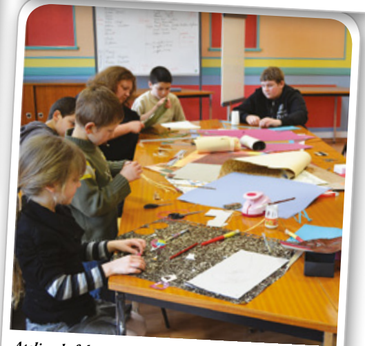
Atelier de fabrication de bijoux en papier, mis en place par le Programme de Réussite Educative