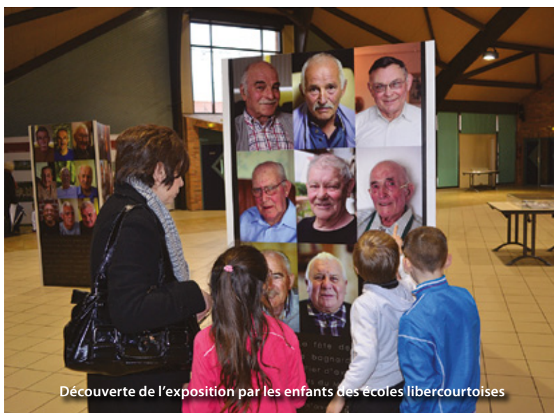
Découverte de l'exposition par les enfants des écoles libercourtoises

Depuis la fermeture de la dernière mine à Oignies en 1990, une politique de reconversion du territoire a été initiée et développée. Le Bassin minier a ainsi évolué grâce à divers programmes de développement durable, de réhabilitation et de valorisation de son patrimoine des Houillères. De cette dynamique sont nés de nombreux projets, dont l'exposition « Mineurs du Monde » du Conseil Régional. Elle a pour vocation de rapprocher les bassins miniers internationaux par leur histoire minière (passée ou encore actuelle), leur mémoire et leur identité. Mais elle leur permet également de partager les réussites et les échecs de leur