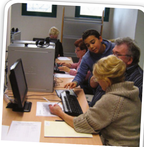
Atelier Cyber-Séniors organisé à l'ESCALE