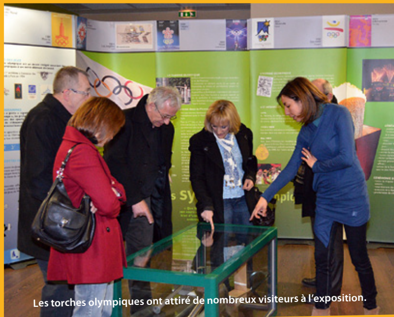
Les torches olympiques ont attiré de nombreux visiteurs à l'exposition.

L'exposition « Au cœur de l'Olympisme » du Conseil Général a été présentée au COSEC Léo Lagrange. Les enfants de l'accueil des centres de loisirs ainsi que le grand public ont pu découvrir toute l'histoire de l'Olympisme agrémentée de nombreuses pièces d'une des plus belles collections au monde, celle de Fabrice Bourgain. Entre autres, trois torches olympiques ont été exposées, celle de Munich, Barcelone et Albertville, ainsi que de nombreuses médailles en or, argent et bronze.