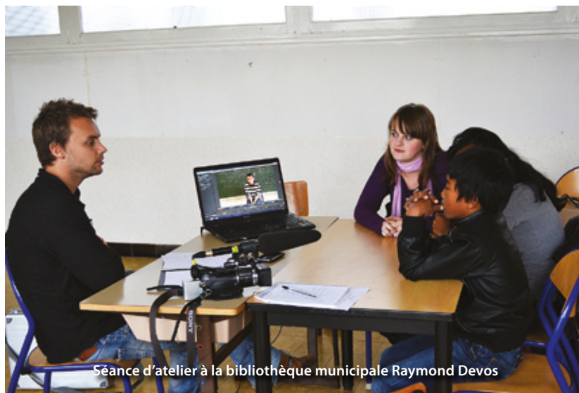
Séance d'atelier à la bibliothèque municipale Raymond Devos

Avec l'émergence des nouveaux modes de communication (Internet, téléphone portable), nos pratiques langagières ont évolué. Cela est d'autant plus visible chez la jeune génération qui s'approprie ce nouveau langage comme mode d'expression quotidien, au grand dam de leurs parents.