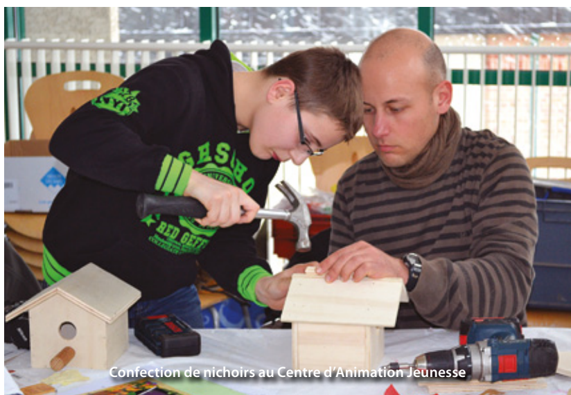
Confection de nichoirs au Centre d'Animation Jeunesse