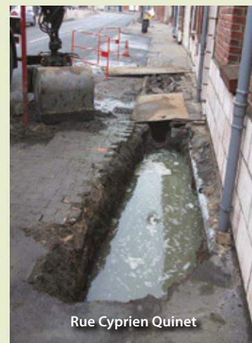
Rue Cyprien Quinet

Mardi 6 Mars, les importantes chutes de neige ont provoqué des pannes d'électricité chez une grande partie des foyers libercourtois. En effet, les différents câbles enterrés permettant d'alimenter les logements en électricité se sont retrouvés dans l'eau. A la demande de Monsieur le Maire, EDF est intervenu toute la nuit du mardi au mercredi, ce qui a permis de réalimenter progressivement les différents quartiers.