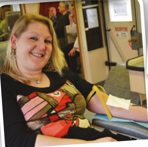
Journée de don du sang, rue Saint Ghislain