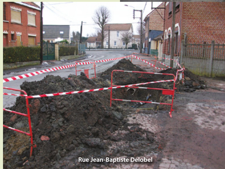
Rue Jean-Baptiste Delobel