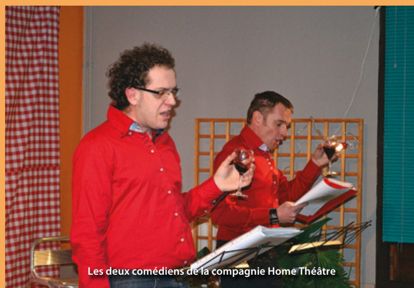
Les deux comédiens de la compagnie Home Théâtre

A l'occasion du Printemps des Poètes, la bibliothèque Raymond Devos et la compagnie Home Théâtre ont invité la population à passer une soirée théâtrale et culinaire, « Les mots à la bouche », alchimie savoureuse de mots et de mets.