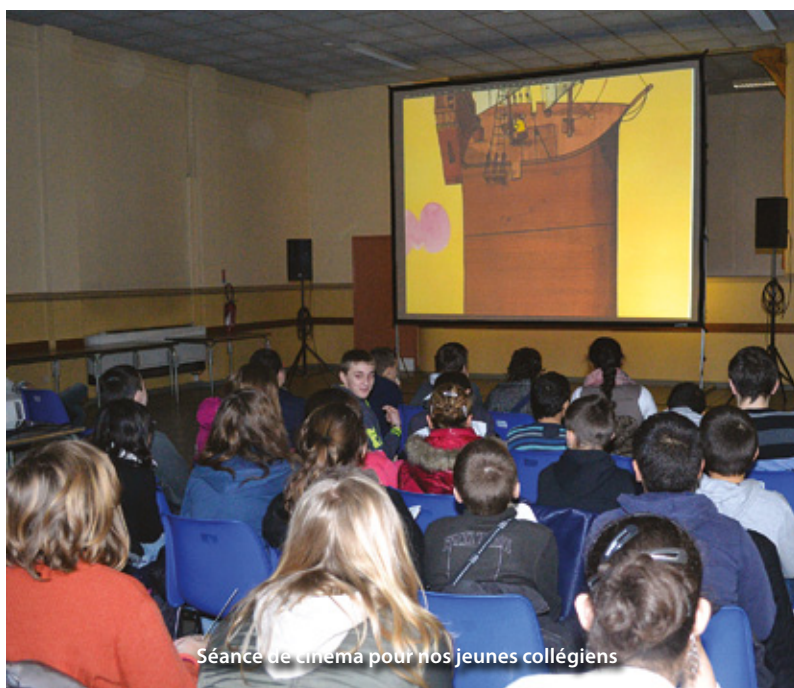
Séance de cinéma pour nos jeunes collégiens

Le cinéma a envahi la salle Meurant ! Le service Jeunesse a ainsi permis pendant toute une journée aux élèves de primaires, du collège mais aussi au grand public de découvrir onze courts-métrages tournés en France, Belgique, Portugal, Espagne, Royaume-Uni, Argentine et même en Iran. Les plus jeunes ont également visionné différents courts-métrages d'animation et en ont appris davantage sur la réalisation de ce type de films, les métiers du cinéma, etc. Par exemple, Le court-métrage « NOKIA DOT », venu du Royaume-