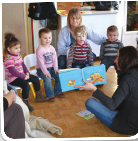
Lecture à destination des enfants de la Halte-Garderie