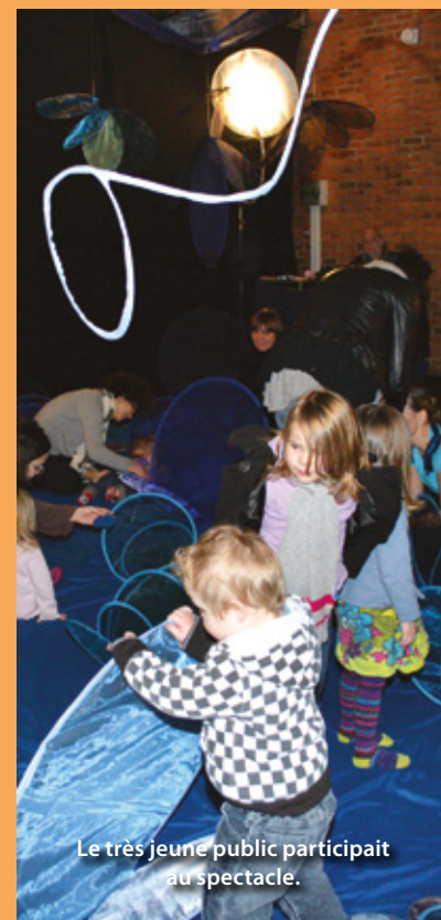
Le très jeune public participait au spectacle.

La bibliothèque Raymond Devos a invité les très jeunes libercourtois jusqu'à 3 ans et leurs parents à deux représentations du spectacle de la Compagnie Nathalie Cornille.