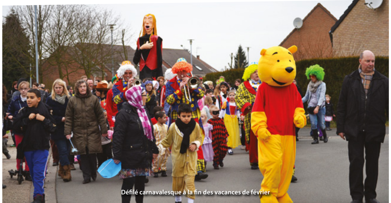
Défilé carnavalesque à la fin des vacances de février

Confection de masques, de costumes, d'instruments de musique, animation lecture autour du thème du bal masqué, chants carnavalesques : le thème a été respecté à la lettre par les enfants de l'accueil de loisirs et par les adolescents du Centre Animation Jeunesse. Ils ont également pu se dépenser grâce aux activités sportives proposées, des plus classiques : trampoline, jeux d'adresses et de réflexes, mini basket, badminton, vélo ; aux plus originales : crosse québécoise, Kin Ball, du