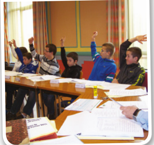
La première séance du Conseil Municipal des Jeunes pour 2012