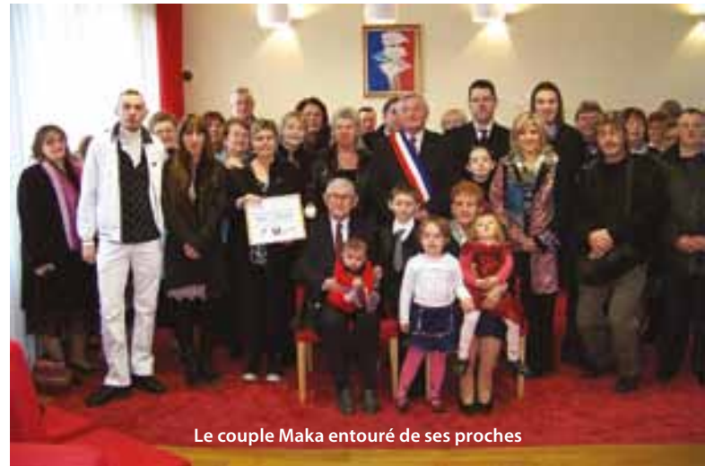
Le couple Maka entouré de ses proches