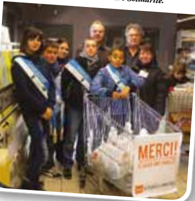
Le Conseil Municipal des Jeunes a participé à la journée de collecte de denrées alimentaires organisée par Libercourt Solidarité.