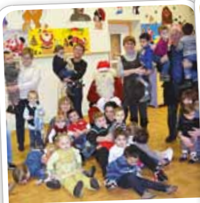
Visite du Père Noël à la Halte-Garderie