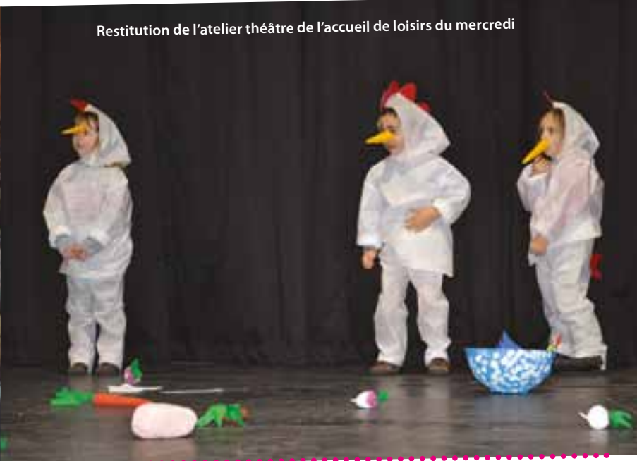
Restitution de l'atelier théâtre de l'accueil de loisirs du mercredi