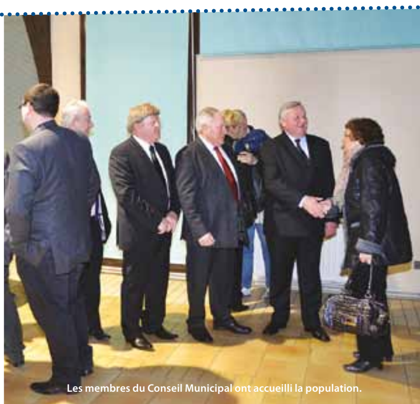
Les membres du Conseil Municipal ont accueilli la population.