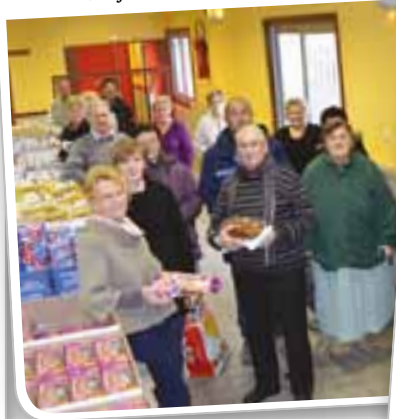
Distribution des colis de fin d'année aux familles suivies par le CCAS