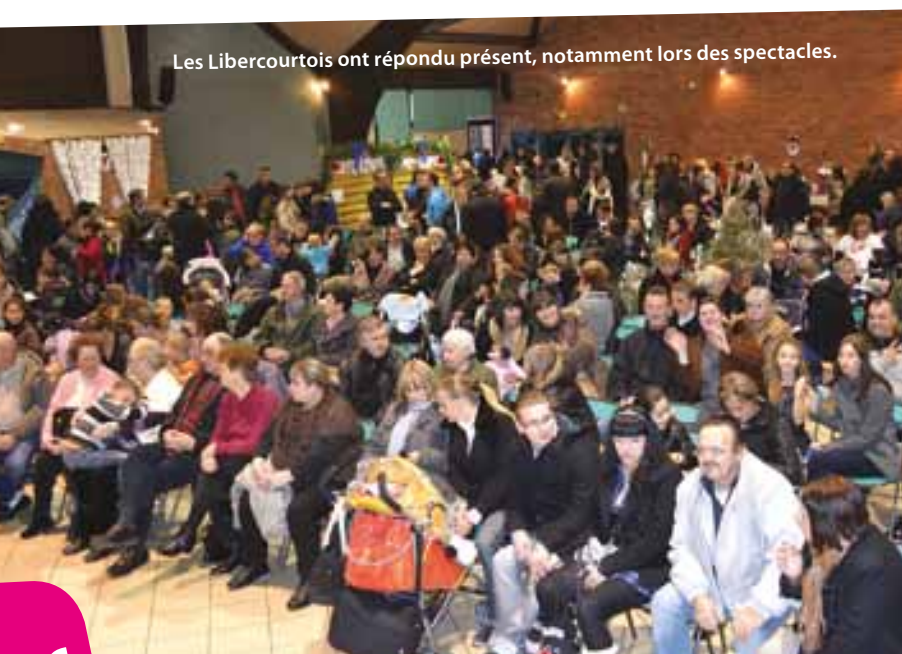
Les Libercourtois ont répondu présent, notamment lors des spectacles.

Dance et Vice Versa ont fait vibrer la salle avec des rythmes endiablés. Les majorettes du club Les pervenches ont montré leur maîtrise du bâton. L'association Quarter Horse a apporté une ambiance country toute particulière. N'oublions pas les promenades en calèche organisées le dimanche qui ont remporté tous les suffrages ! Ce marché n'aurait pas eu la même saveur sans la visite du père-noël et de son lutin, venus s'assurer que les enfants étaient bien sages et également distribuer quelques friandises !