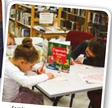
Le goûter conté de Noël a permis aux enfants de s'initier au dessin.