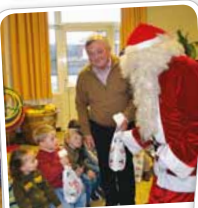
Distribution de friandise en compagnie du Père Noël, à l'école Maternelle Jaurès