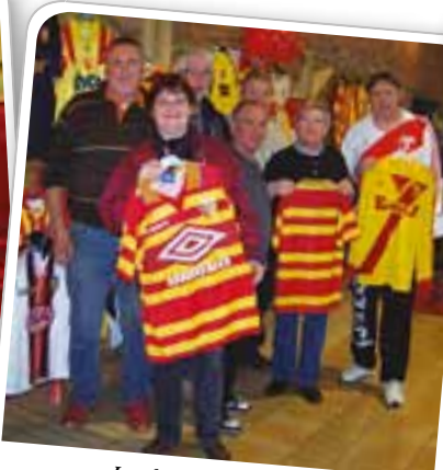
Le salon des collectionneurs organisé par le club de Tennis