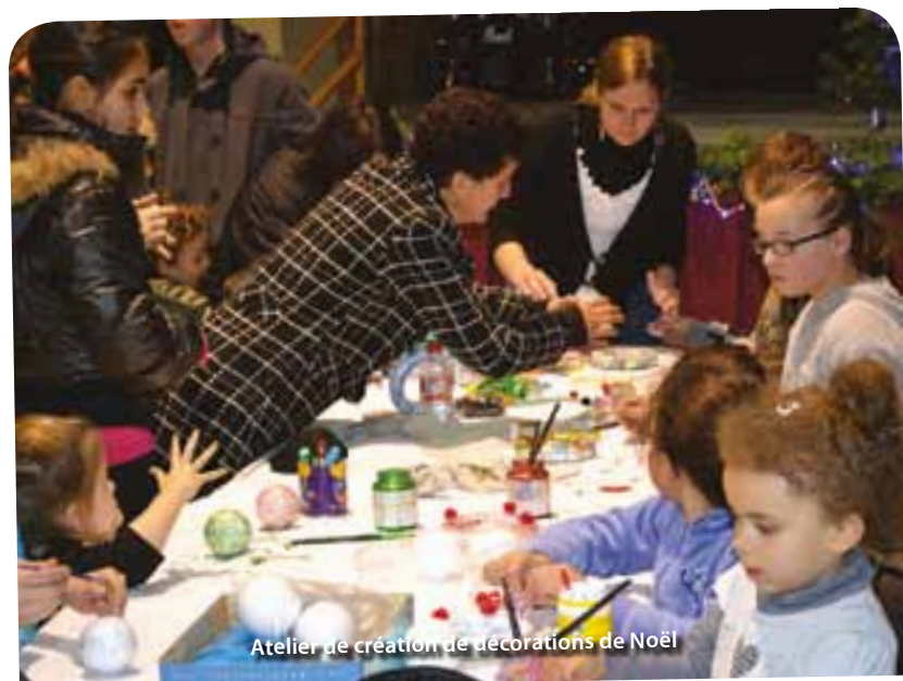
Atelier de création de décorations de Noël

moment en famille : Confection de décorations de Noël et de cartes de vœux, pyrogravure, peinture sur verre, maquillage. Pendant que les enfants se faisaient maquiller aux couleurs des fêtes, les parents pouvaient également profiter d'un atelier soin esthétique. L'école de musique a également pris part à la manifestation avec l'admirable prestation de l'école des Cadets. Les enfants du Centre Animation Jeunesse ont montré leur talent de danseur hip hop. La bibliothèque a quant à elle proposé un atelier lecture et lettre au père-noël. Plusieurs associations libercourtoises ont également participé à la réussite de ces deux jours : les associations Identita