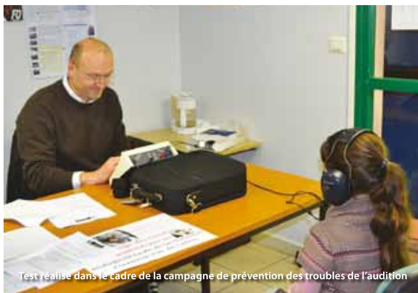
Test réalisé dans le cadre de la campagne de prévention des troubles de l'audition

La 1 ère rencontre santé a donné l'occasion aux nombreux parents présents d'en apprendre davantage sur les problèmes de vue que peuvent rencontrer les enfants. Un spectacle intitulé Rêves magiques de la Compagnie Festi'môme a d'abord ouvert cette journée. Ensuite, pendant que les enfants participaient à divers ateliers, leurs parents ont obtenu des réponses aux questions qu'ils se posaient sur la vision de leurs bambins, grâce