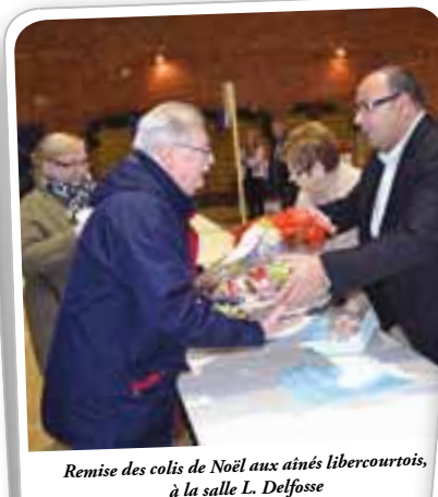
Remise des colis de Noël aux aînés libercourtois, à la salle L. Delfosse