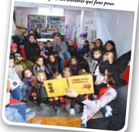
Le goûter conté spécial Halloween a rassemblé les adeptes des histoires qui font peur.