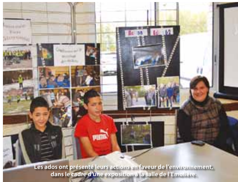
Les ados ont présenté leurs actions en faveur de l'environnement, dans le cadre d'une exposition à la salle de l'Emolère.