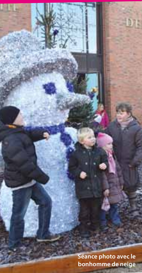
Séance photo avec le bonhomme de neige

Organisé par la municipalité et le Comité du Personnel Communal de Libercourt, le marché de la Saint Nicolas a offert un week-end de retour en enfance à tous !