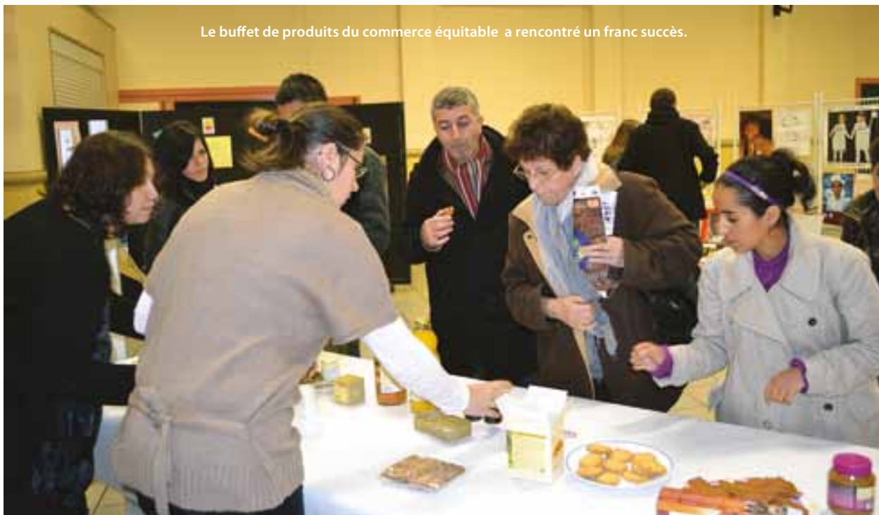
Le buffet de produits du commerce équitable a rencontré un franc succès.

Le PIJ, situé à l'ESCALE, a ainsi invité la population à participer, salle Meurant, à une journée de solidarité. Pour aborder le thème de la consommation, un documentaire programmé dans le cadre du Festival AlimentTerre 2011 intitulé