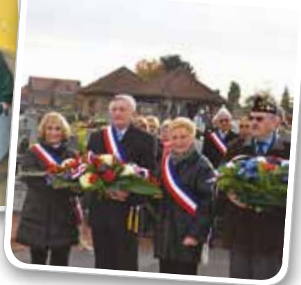
Commémoration de la Toussaint à la nécropole militaire du cimetière communal