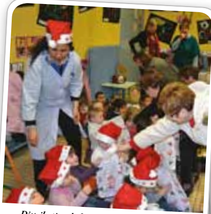
Distribution de friandises à l'école maternelle A. Pantigny, avant les vacances de Noël