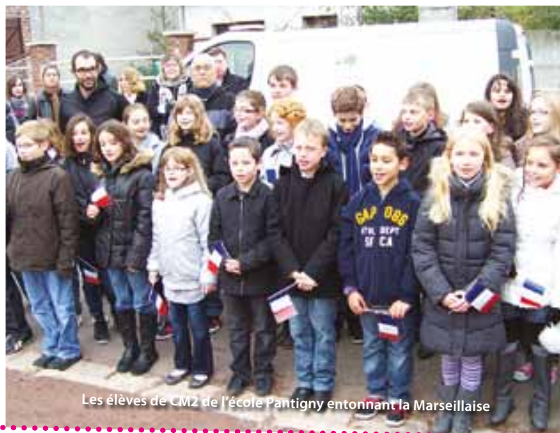
Les élèves de CM2 de l'école Pantigny entonnant la Marseillaise

au Monument aux morts. Le traditionnel dépôt de gerbe a eu lieu, accompagné des discours des différents intervenants. Les élèves des classes de CM2 de l'école Pantigny ont ensuite entonné l'hymne national, donnant une dimension toute particulière à cette commémoration. L'ensemble des participants s'est ensuite dirigé vers la nécropole militaire, le défilé empruntant les rues Cyprien Quinet, Jules Leblanc et du Cimetière. Des gerbes ont également été déposées et un hommage de paix a été rendu par les écoliers. Ensuite, une réception offerte par la municipalité s'est tenue, salle du Verger. La journée s'est poursuivie avec le banquet des Anciens Combattants, salle Delfosse.