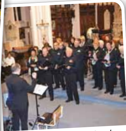
Concert d'hiver de l'harmonie La Concorde, à l'église Notre Dame