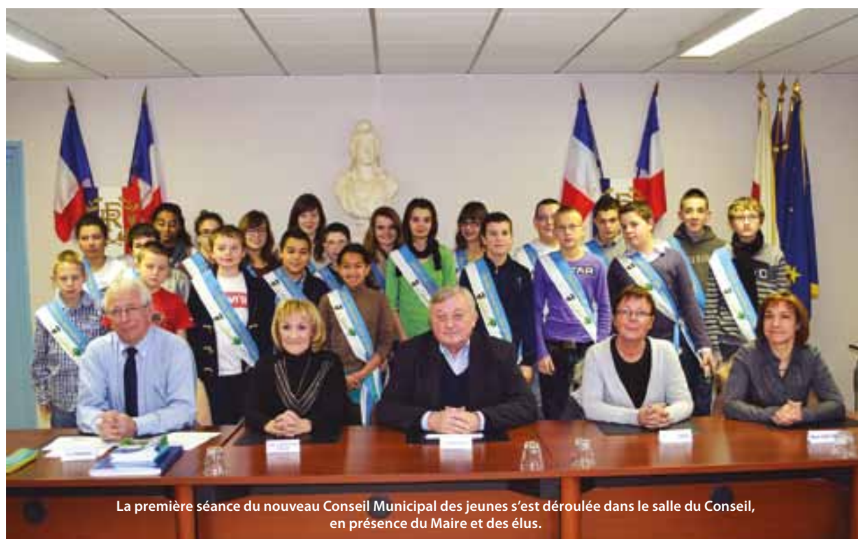
La première séance du nouveau Conseil Municipal des jeunes s'est déroulée dans le salle du Conseil, en présence du Maire et des élus.