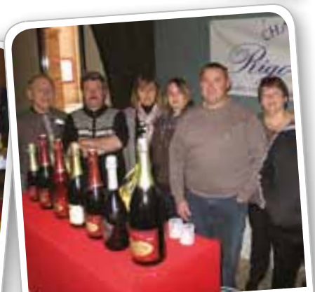
Le salon du goût et de la qualité organisé par l'amicale des Anciens Sapeurs Pompiers Libercourtois