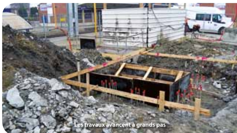
Les travaux avancent à grands pas