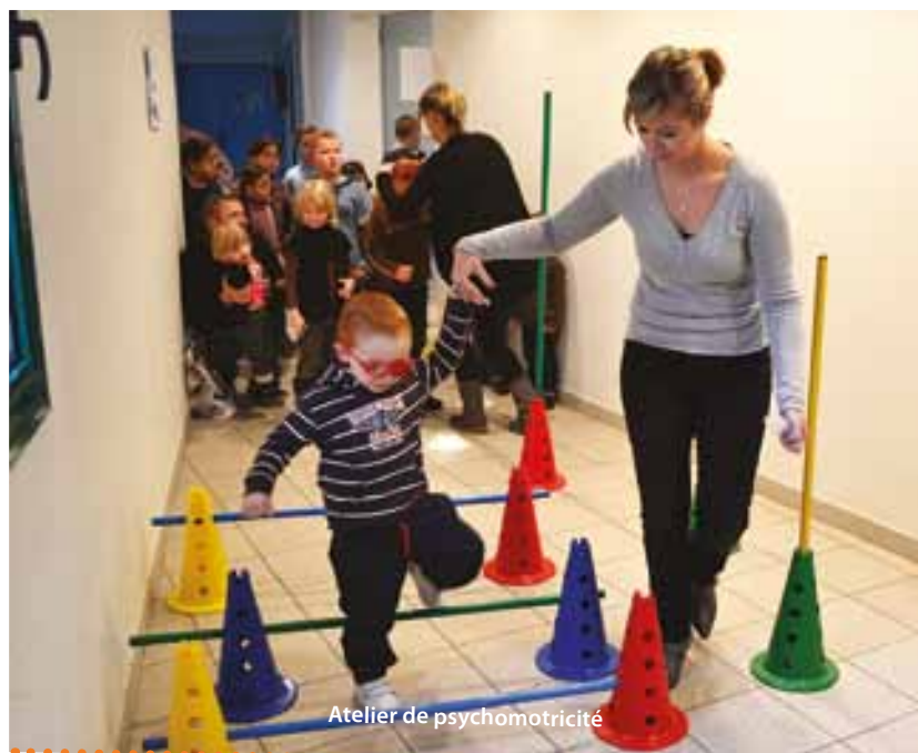
Atelier de psychomotricité