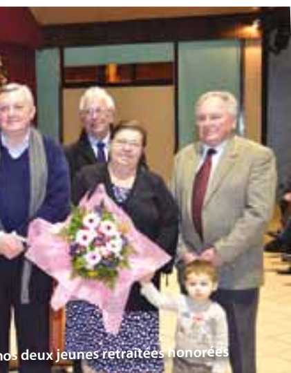
nos deux jeunes retraitées honorées

« Libercourt a des atouts considérables. Elle a changé et elle continue de changer sous l'impulsion de ce Conseil Municipal et des services municipaux que je remercie encore. Elle renforce son attractivité comme nous le témoigne cette nombreuse population de jeunes couples venus des métropoles voisines et désireux de s'installer dans un cadre agréable, de dimension humaine et bien desservi. Longtemps j'ai répété que la ville était en mutation, qu'elle se préparait. Aujourd'hui, je suis fier de vous dire qu'elle est prête. Encore une fois, chers amis, recevez mes vœux les plus chaleureux de santé, de bonheur et de prospérité à vous, votre famille et tous vos proches. »