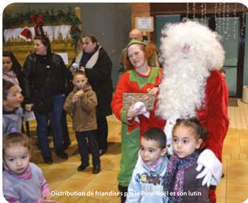
Distribution de friandises par le Père Noël et son lutin

Il ne fallait pas forcément être un enfant pour apprécier les diverses animations proposées pendant deux jours, salle Delfosse et sur le Parvis de l'hôtel de ville. Un lâcher de pigeons par l'association des Colombophiles a lancé cette nouvelle édition, suivi du traditionnel discours de Monsieur le Maire et de la dégustation d'un buffet réalisé par les mamans du Programme de Réussite Educative et les dames de service. On pouvait trouver dans les chalets de quoi contenter toutes les faims : crêpe, gaufre, quiche, tarte, soupe, chocolat chaud... Mais aussi trouver une idée cadeau pour les fêtes : éléments de décoration, bijoux, etc. A la salle Delfosse, les enfants et parents ont profité des différents ateliers mis en place, l'occasion de partager un agréable